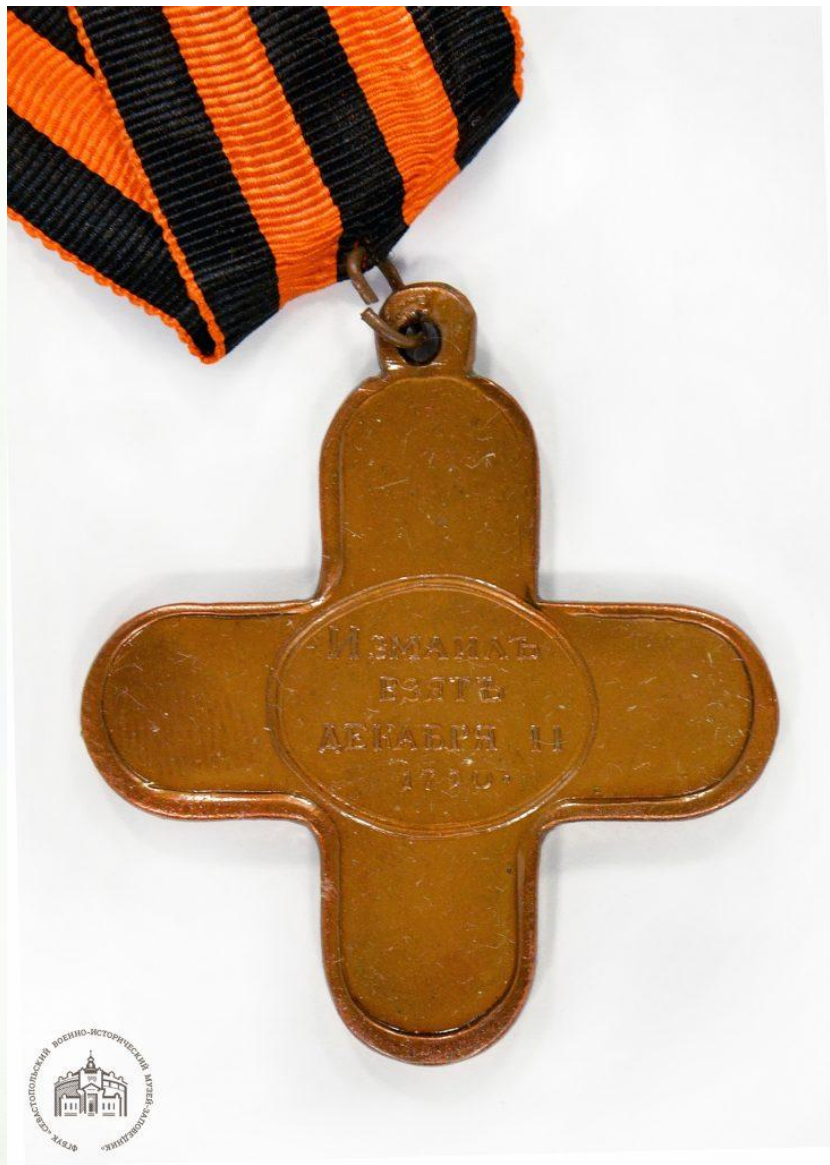
Крест «За взятие Измаила» (копия). XIX в.