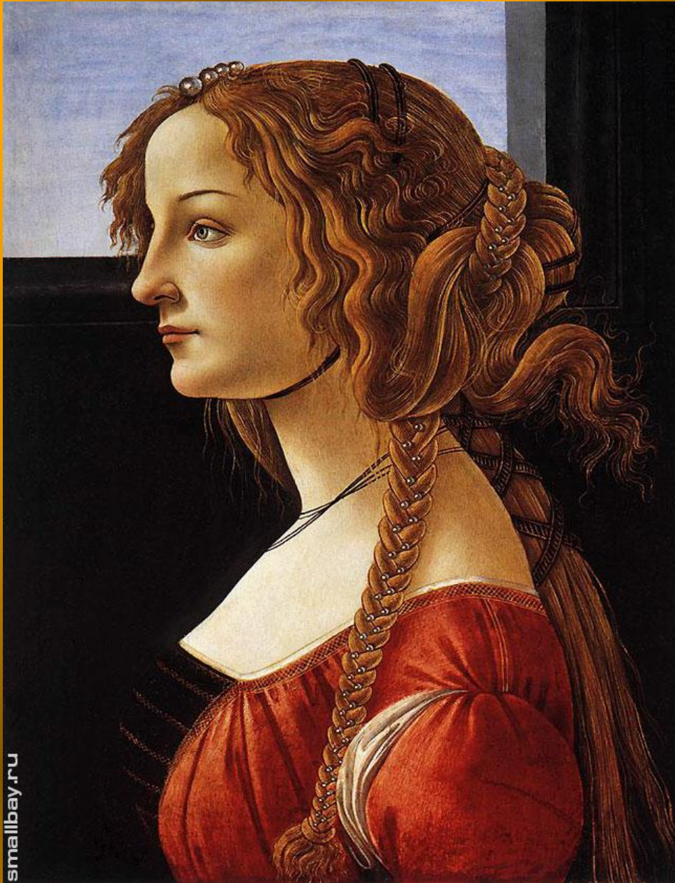
Портрет Симоны Веспуччи