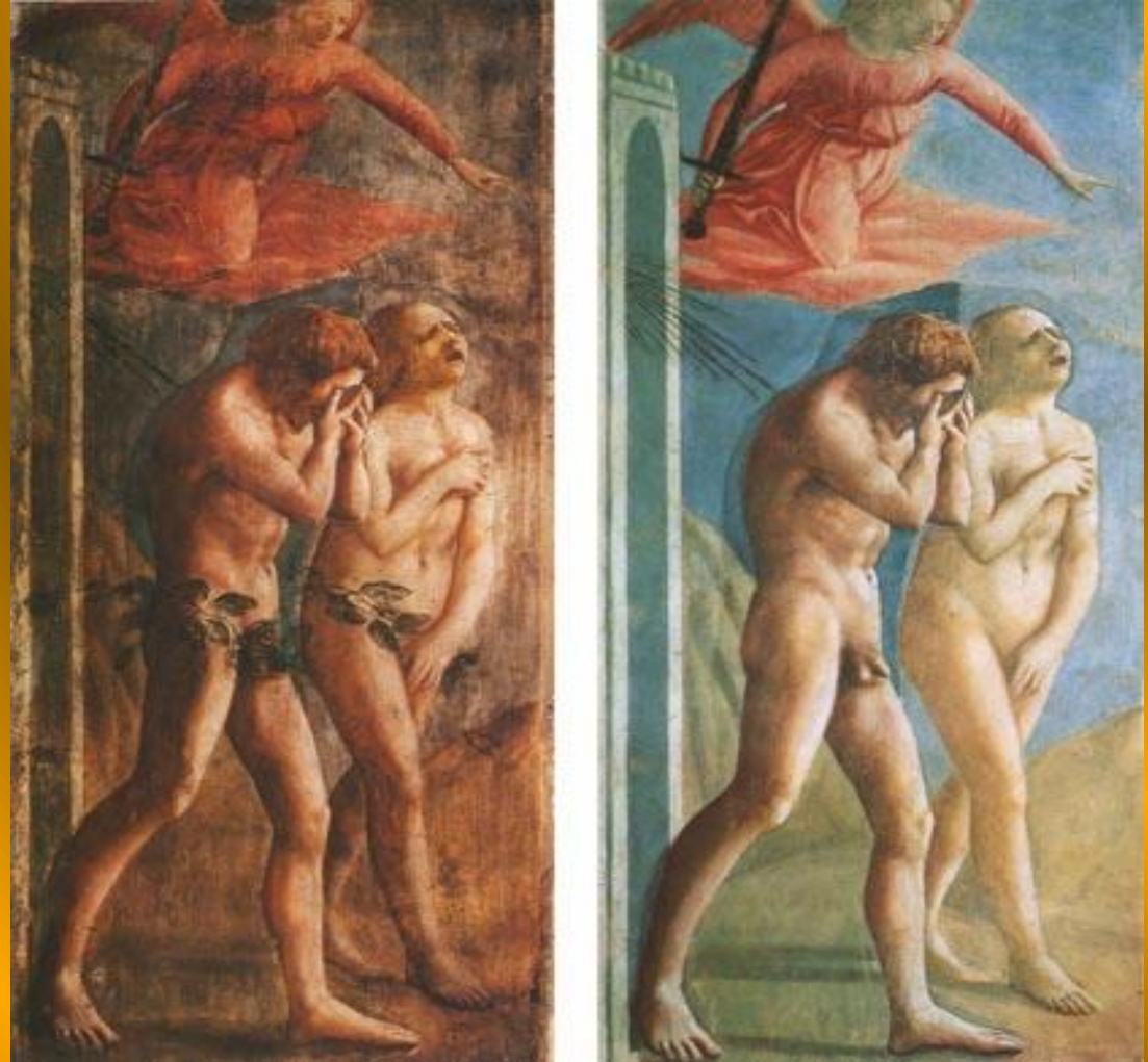
Изгнание из рая