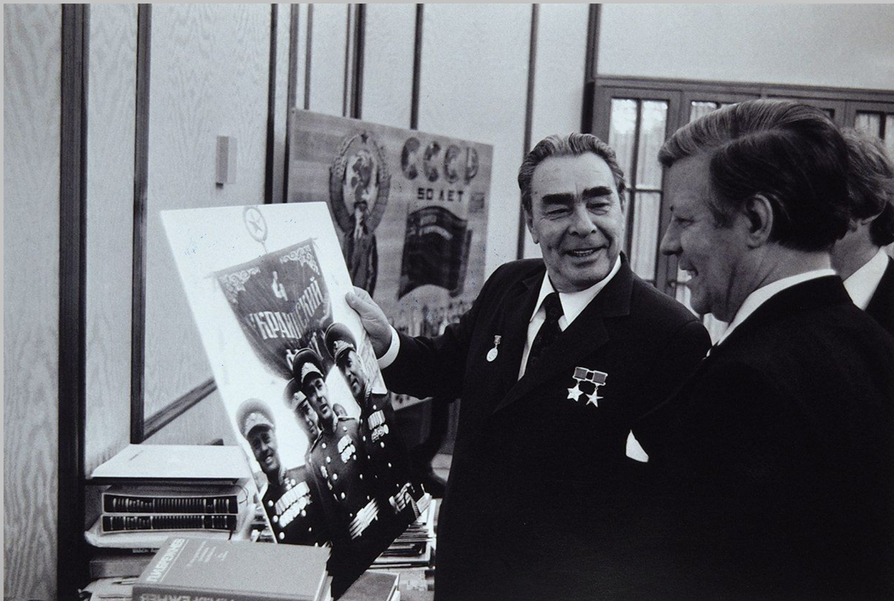
Официальный визит канцлера ФРГ Гельмута Шмидта в СССР.