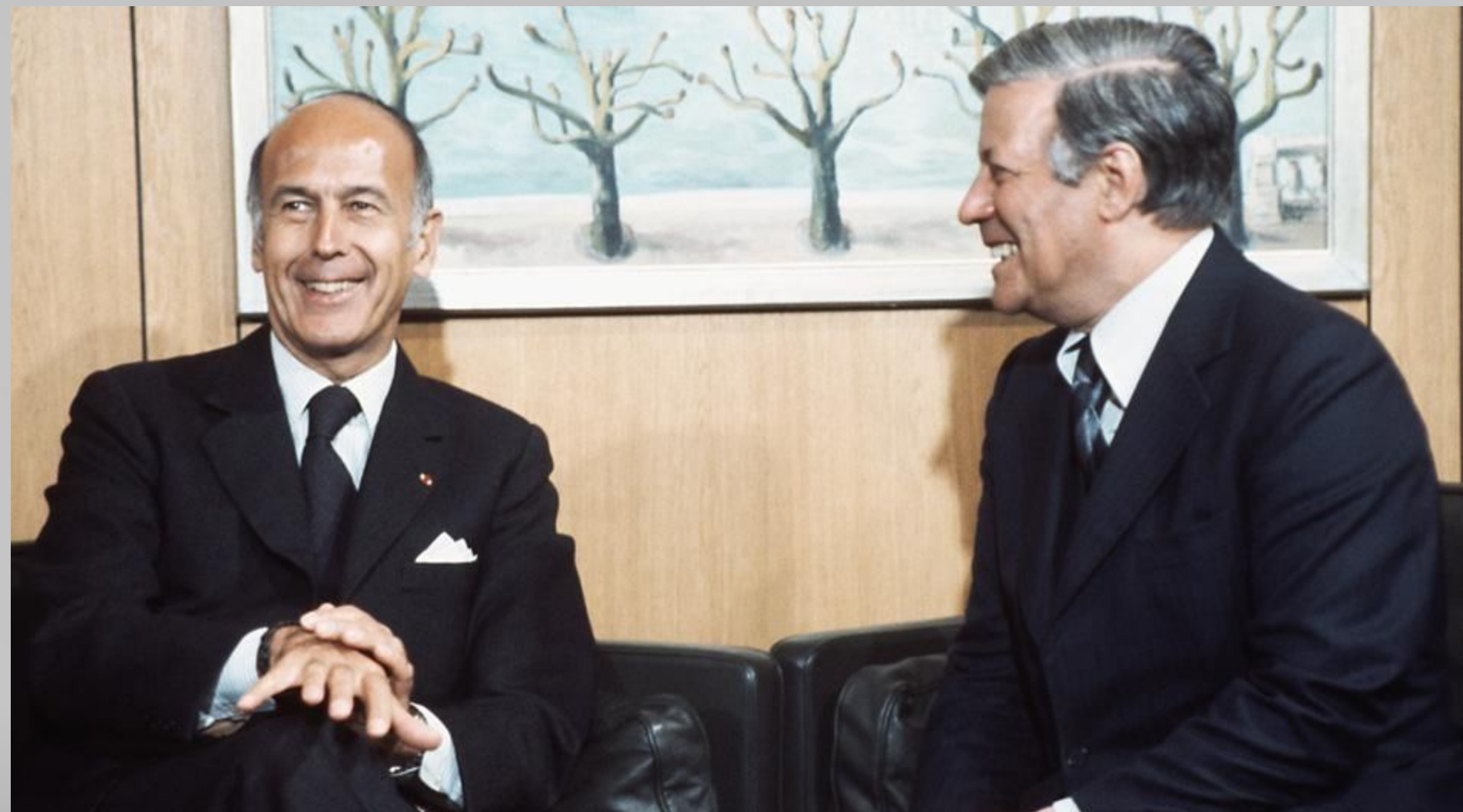
Гельмут Шмидт и президент Франции Валери Жискар д'Эстен