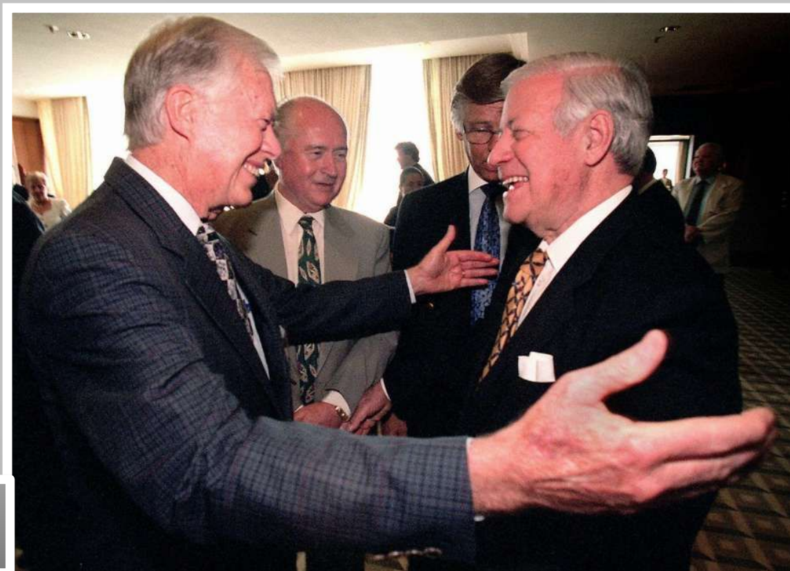
Джимми Картер и Гельмут Шмидт. Нидерланды

На проведение внешнеполитического курса ФРГ очень повлиял кризис политики разрядки, заметно обострившиеся на рубеже 1970-1980-х