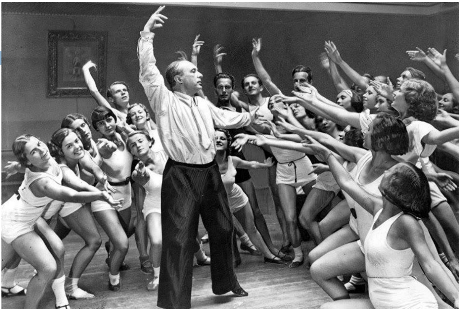
Рудольф фон Лабан (1879-1958)