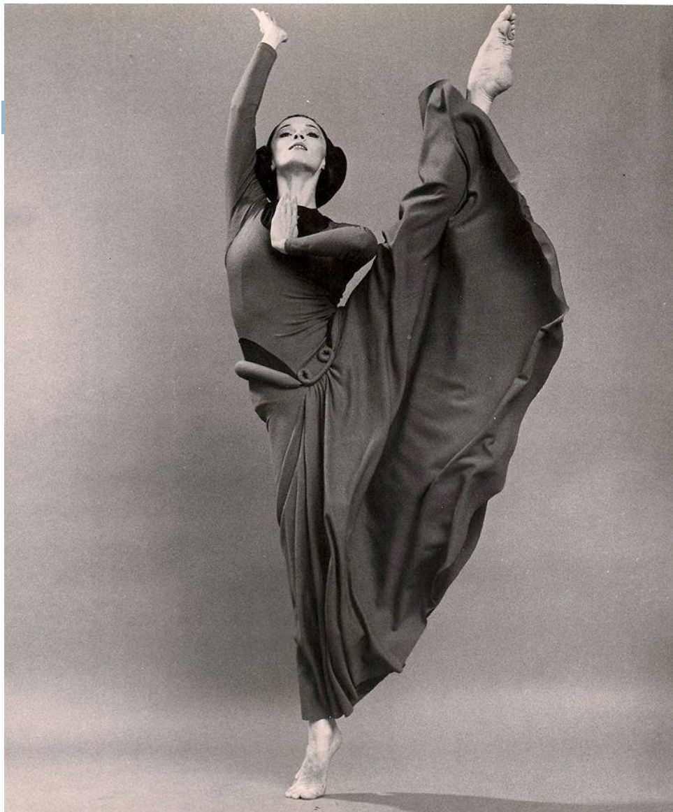
Марта Грэхем (1894-1991)