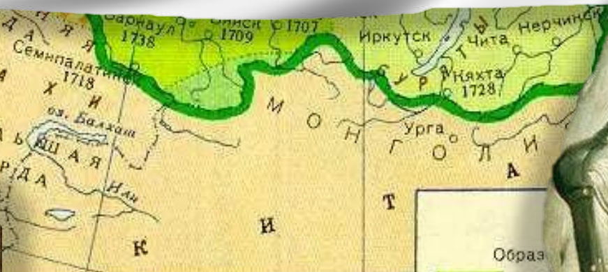
Образ с 166 (при Земли Малой и Средней Казахских орд, вошедших в подданство России с 1731 г. Восточная Грузия под покровительством 1716 - пятн. основания городов в XVIII в.