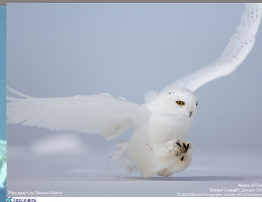
Photograph by Vincent Munier Visions of Earth National Geographic, January 2007 © 2007 National Geographic Society. All rights reserved.