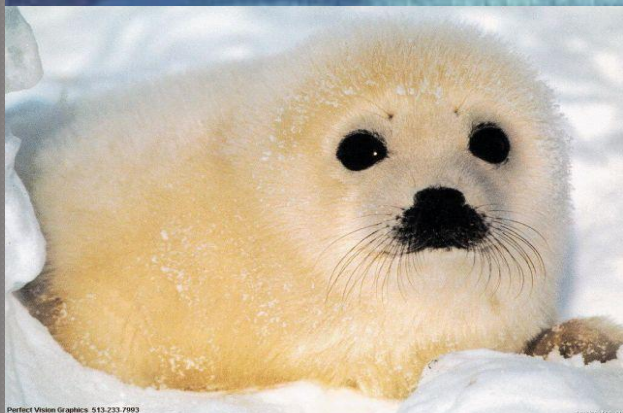
Perfect Vision Graphics 513.233.7993