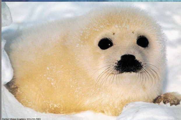
Perfect Vision Graphics 513.233.7993