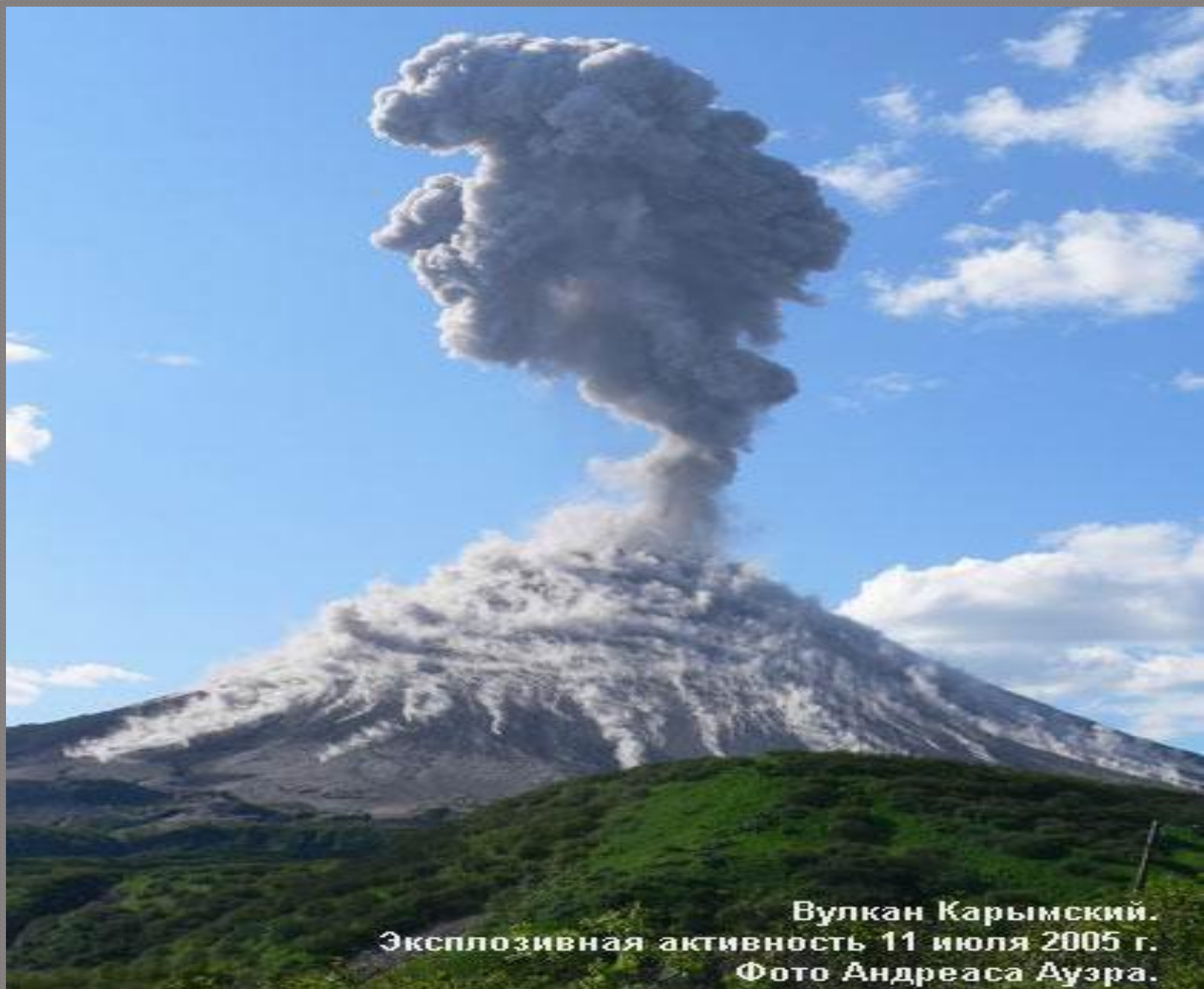
Вулкан Карымский. Эксплозивная активность 11 июля 2005 г.