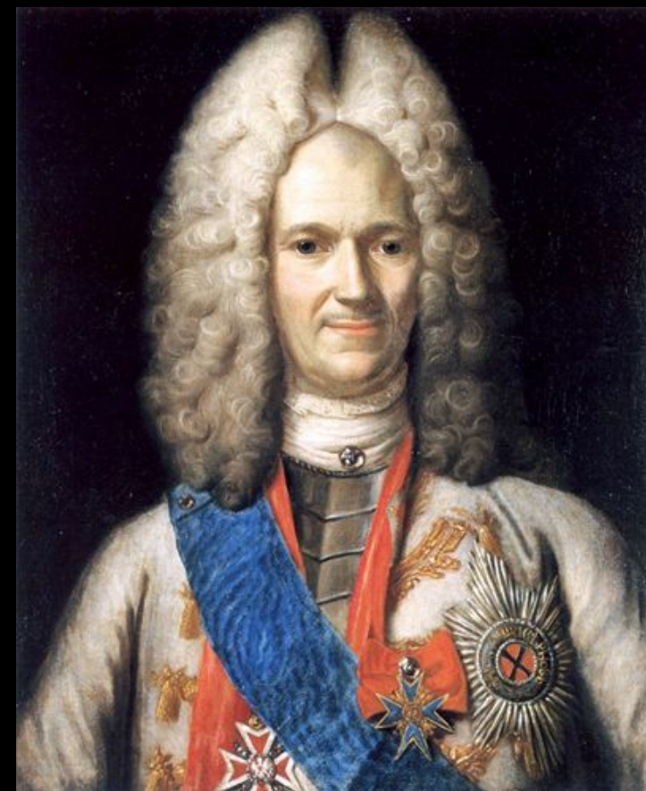
Александр Данилович Меншиков

После смерти Петра I образовались две противоборствующие политические силы: родовая знать выдвигавшие кандидатуру, к которым относились старинные боярские роды Голицыных и Долгоруких, и сподвижников Петра, Меншикова, генерал-прокурор Сената П. И. Ягужинский, генерал И. И. Бутурлин, дипломат и руководитель Тайной канцелярии П. А. Толстой, вице-президент Синода Феофан Прокопович, которые делали ставку на Екатерину I. Впоследствии именно вторую партию поддержали дворянские гвардейские полки, благодаря которым партии Меншикова в итоге удалось одержать победу.