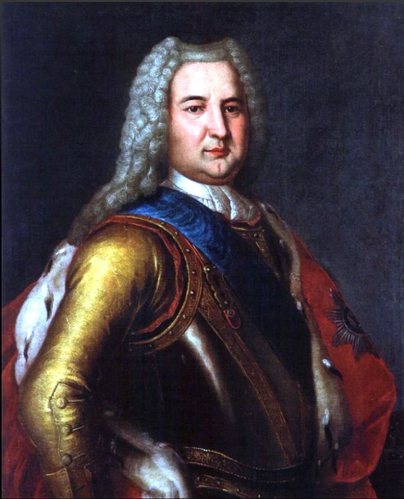
Эрнст Иоганн Бирон

Все злоупотребления власти при Анне Иоанновне патриотические представители российского общества XIX века стали связывать с так называемым засильем немцев при русском дворе, назвав «бироновщиной». Архивные материалы и исследования историков не подтверждают той роли Бирона в расхищении казны, казнях и репрессиях, какую ему приписали позднее литераторы в XIX веке. Вероятной причиной столь одиозного представления о правлении Анны Иоанновны как сумрачной эпохе засилья немцев в среде дворянских интеллигентских кругов помимо деятельности Тайной канцелярии сыграло и то, что в 1730—1740 годах правительство централизованно и очень жёстко следило за налоговыми поступлениями, применяя военно-полицейские меры вплоть до ареста помещиков, у которых имелись недоимки или же обнаруживалось расхищение собранных денег.