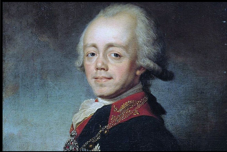
Павел I Петрович