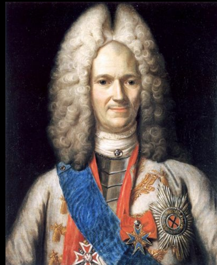
Александр Данилович Меншиков

После смерти Петра I образовались две противоборствующие политические силы: родовая знать выдвигавшие кандидатуру, к которым относились старинные боярские роды Голицыных и Долгоруких, и сподвижников Петра, Меншикова, генерал-прокурор Сената П. И. Ягужинский, генерал И. И. Бутурлин, дипломат и руководитель Тайной канцелярии П. А. Толстой, вице-президент Синода Феофан Прокопович, которые делали ставку на Екатерину I. Впоследствии именно вторую партию поддержали дворянские гвардейские полки, благодаря которым партии Меншикова в итоге удалось одержать победу.