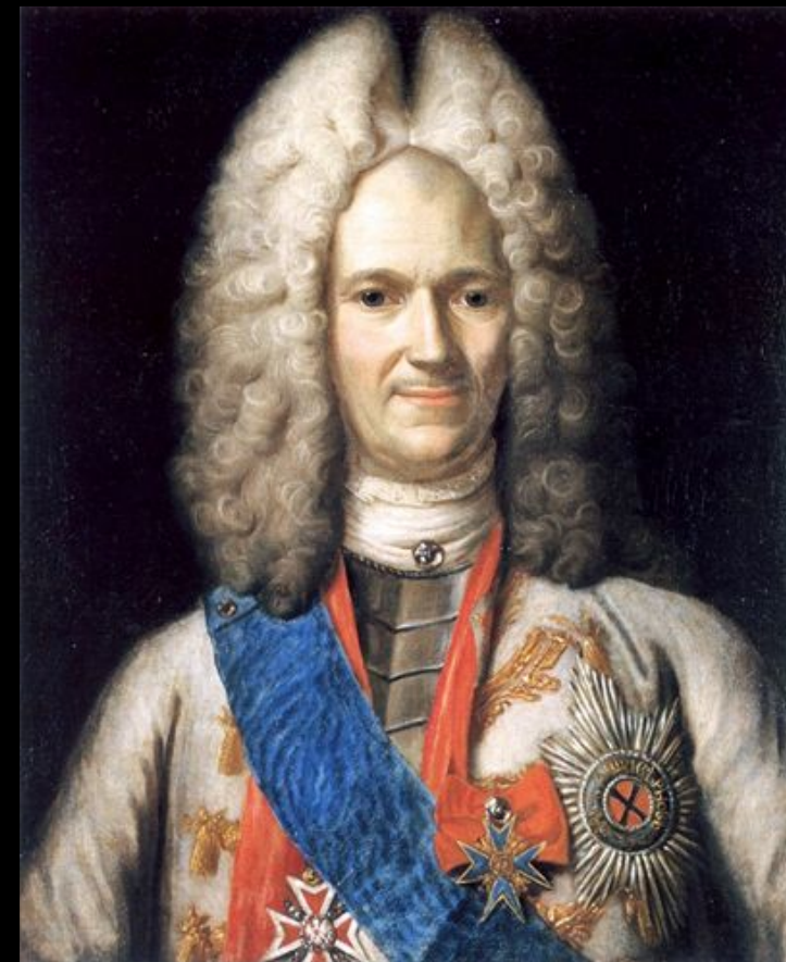
Александр Данилович Меншиков

После смерти Петра I образовались две противоборствующие политические силы: родовая знать выдвигавшие кандидатуру, к которым относились старинные боярские роды Голицыных и Долгоруких, и сподвижников Петра, Меншикова, генерал-прокурор Сената П. И. Ягужинский, генерал И. И. Бутурлин, дипломат и руководитель Тайной канцелярии П. А. Толстой, вице-президент Синода Феофан Прокопович, которые делали ставку на Екатерину I. Впоследствии именно вторую партию поддержали дворянские гвардейские полки, благодаря которым партии Меншикова в итоге удалось одержать победу.