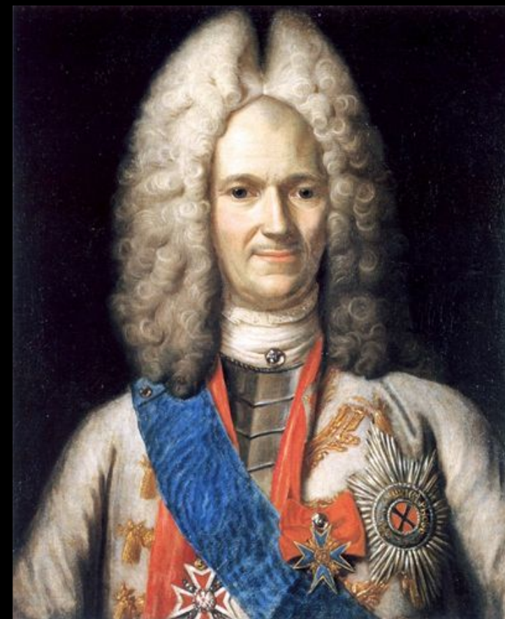
Александр Данилович Меншиков

После смерти Петра I образовались две противоборствующие политические силы: родовая знать выдвигавшие кандидатуру, к которым относились старинные боярские роды Голицыных и Долгоруких, и сподвижников Петра, Меншикова, генерал-прокурор Сената П. И. Ягужинский, генерал И. И. Бутурлин, дипломат и руководитель Тайной канцелярии П. А. Толстой, вице-президент Синода Феофан Прокопович, которые делали ставку на Екатерину I. Впоследствии именно вторую партию поддержали дворянские гвардейские полки, благодаря которым партии Меншикова в итоге удалось одержать победу.