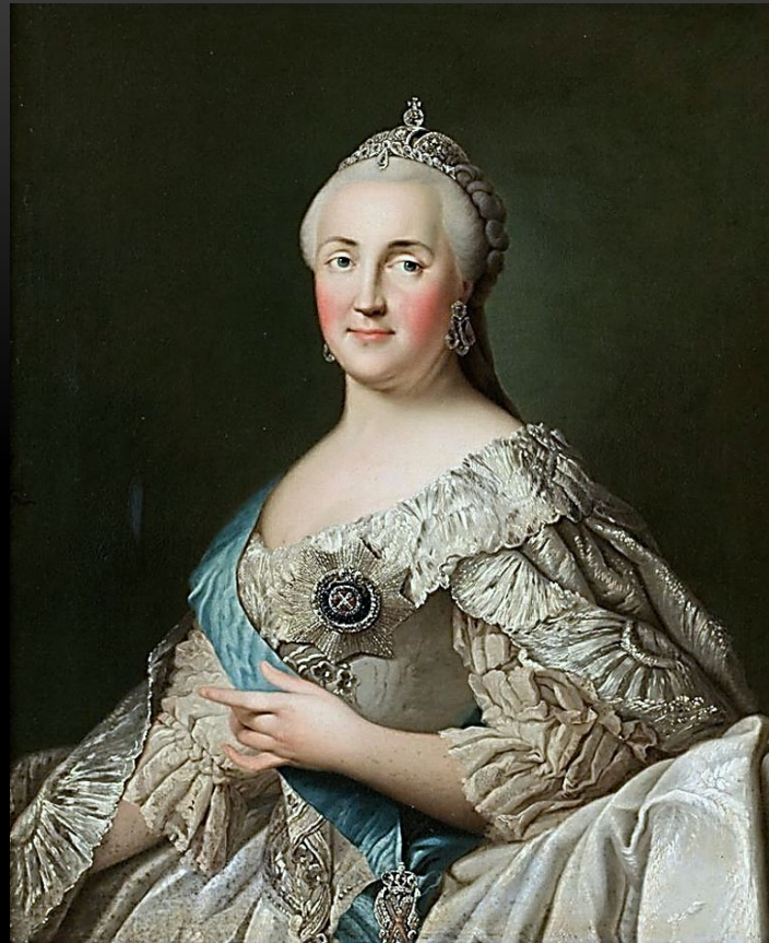
Екатерина II Великая

В 1745 году его женили на принцессе Екатерине Алексеевне, будущей Екатерине II. Считается, что до начала 1750-х годов между мужем и женой вообще не было супружеских отношений, но затем Петру была сделана некая операция после которой в 1754 году Екатерина родила ему сына, будущего императора Павла I. Пётр никогда не скрывал от жены своих увлечений другими женщинами, так же как и она, никогда не скрывала большего количества своих любовников.