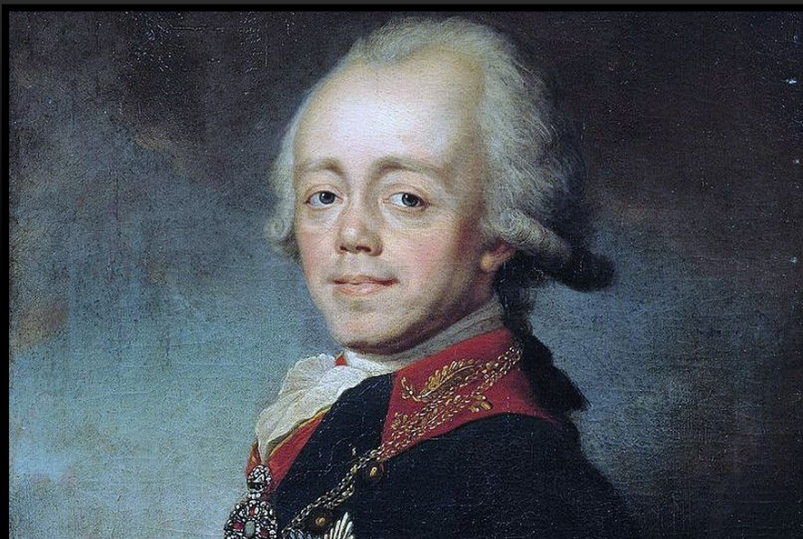
Павел I Петрович