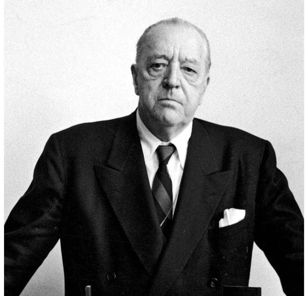
Л. Мис Ван дер Роэ