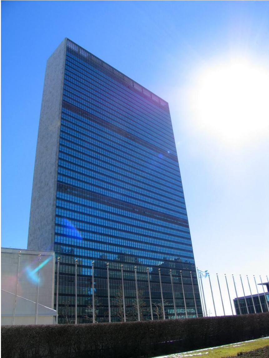
Здание штаб-квартиры ООН в Нью-Йорке, 1947—1950