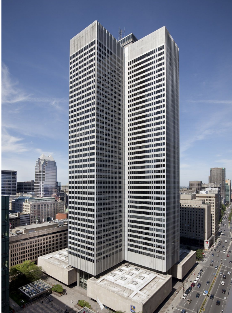
Пляс Виль-Мари (Бэй Юймин, 1962)