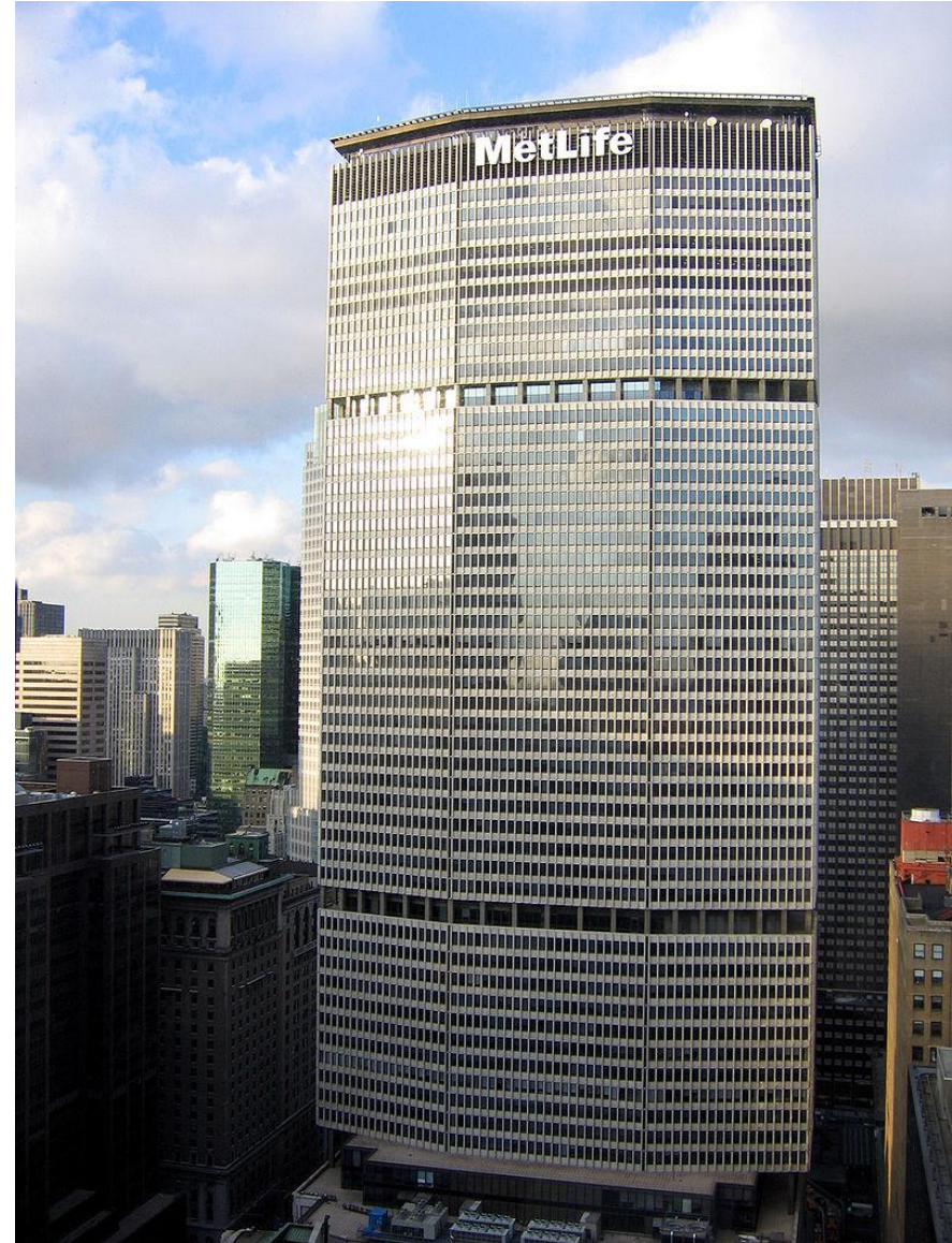
Метлайф-билдинг (Гропиус и др., 1963)