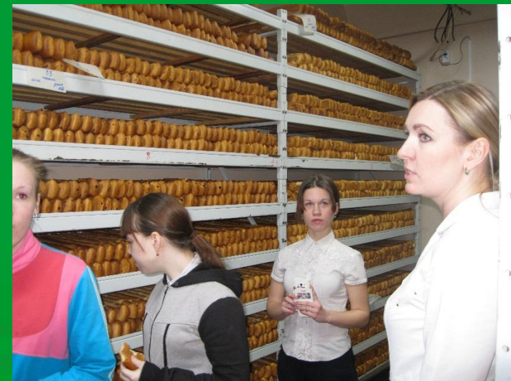
ООО "Сердобский кондитер"