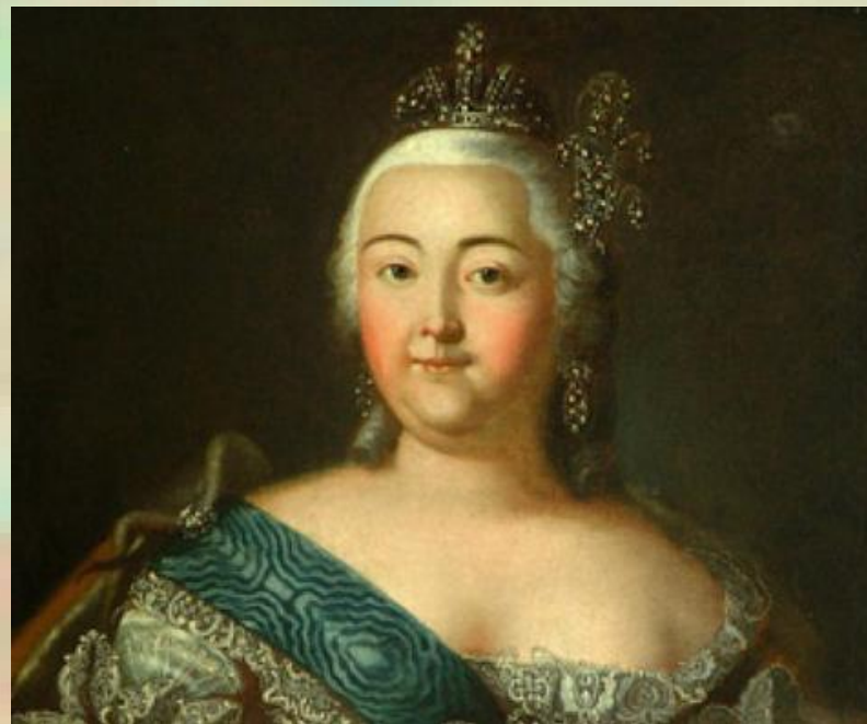
Иллюстрация: Портрет императрицы Елизаветы Петровны. А.П. Антропов. Конец 50-х — начало 60- х годов XVIII века

Во времена Петровы шла на кирпич, при императрице Елизавете - для первого фарфорового завода в России.