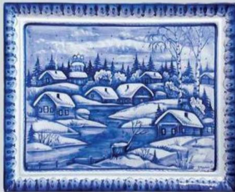
Иллюстрация: посуда гжель с традиционным узором

Первое упоминание - во времена Ивана Калиты. Мастерили керамику, а когда крестьяне, братья Куликовы, раскопали белую глину, - перешли на фарфор.