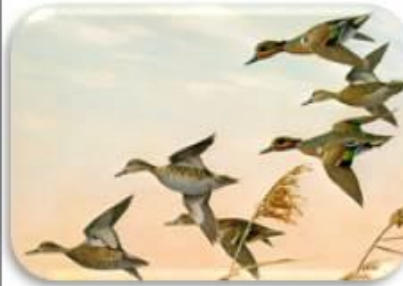
птицы к югу улетают. Ну, когда это бывает?