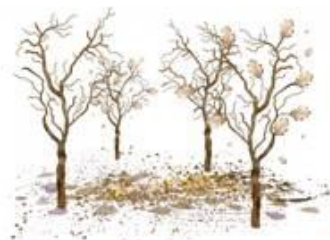
и голый сад