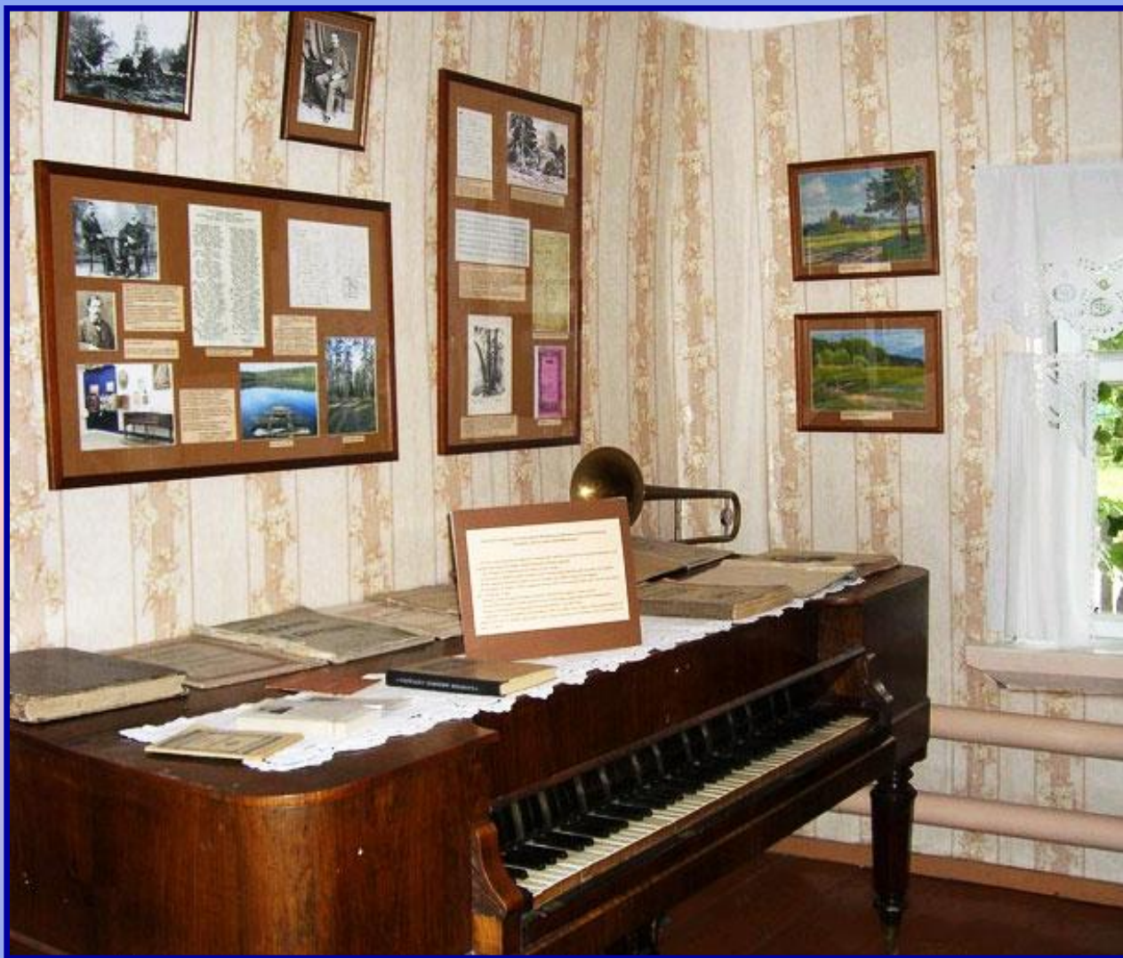
Дом, в котором вырос А.П. Бородин