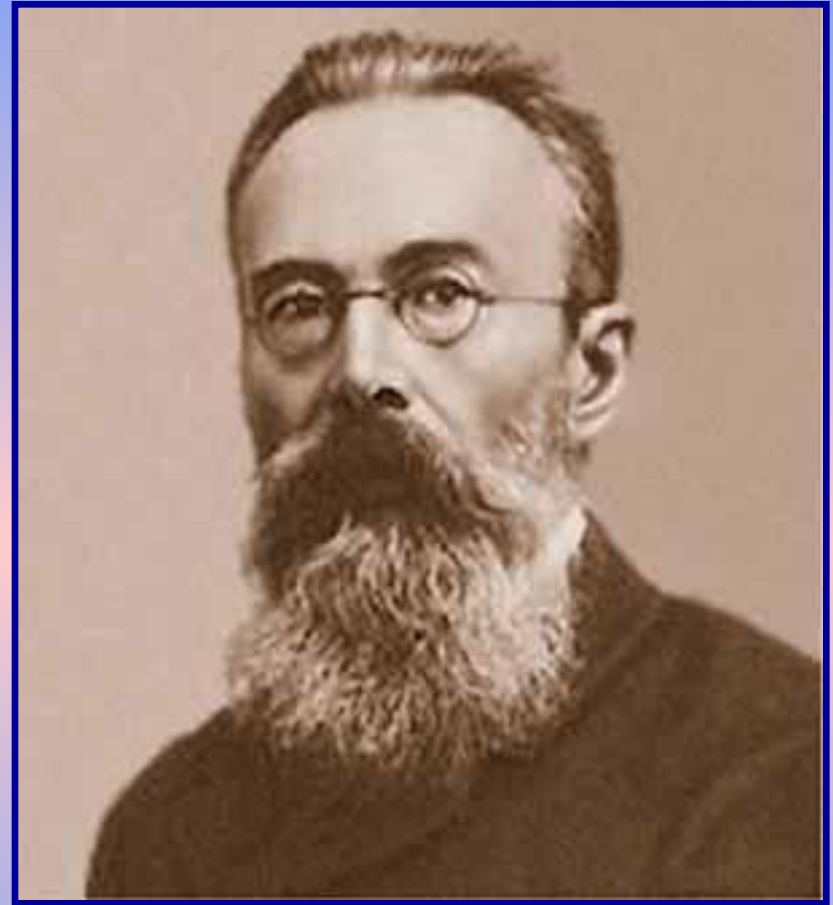
Николай Андреевич Римский – Корсаков и Александр Константинович Глазунов