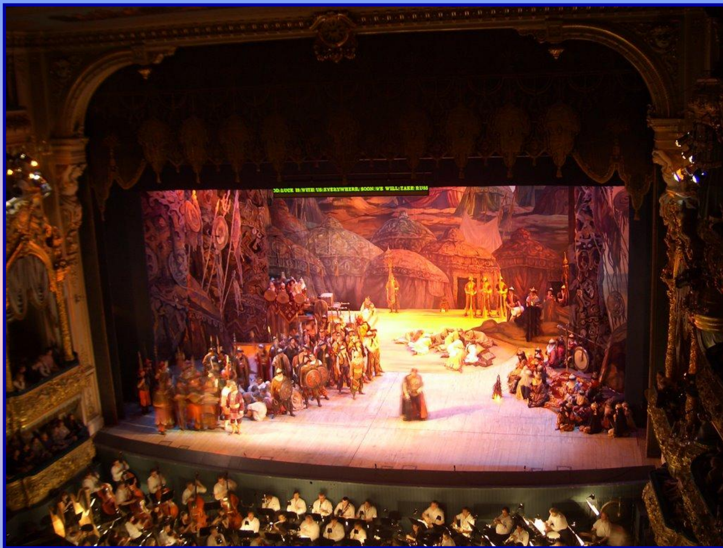
Постановка в Мариинском театре Санкт - Петербурга