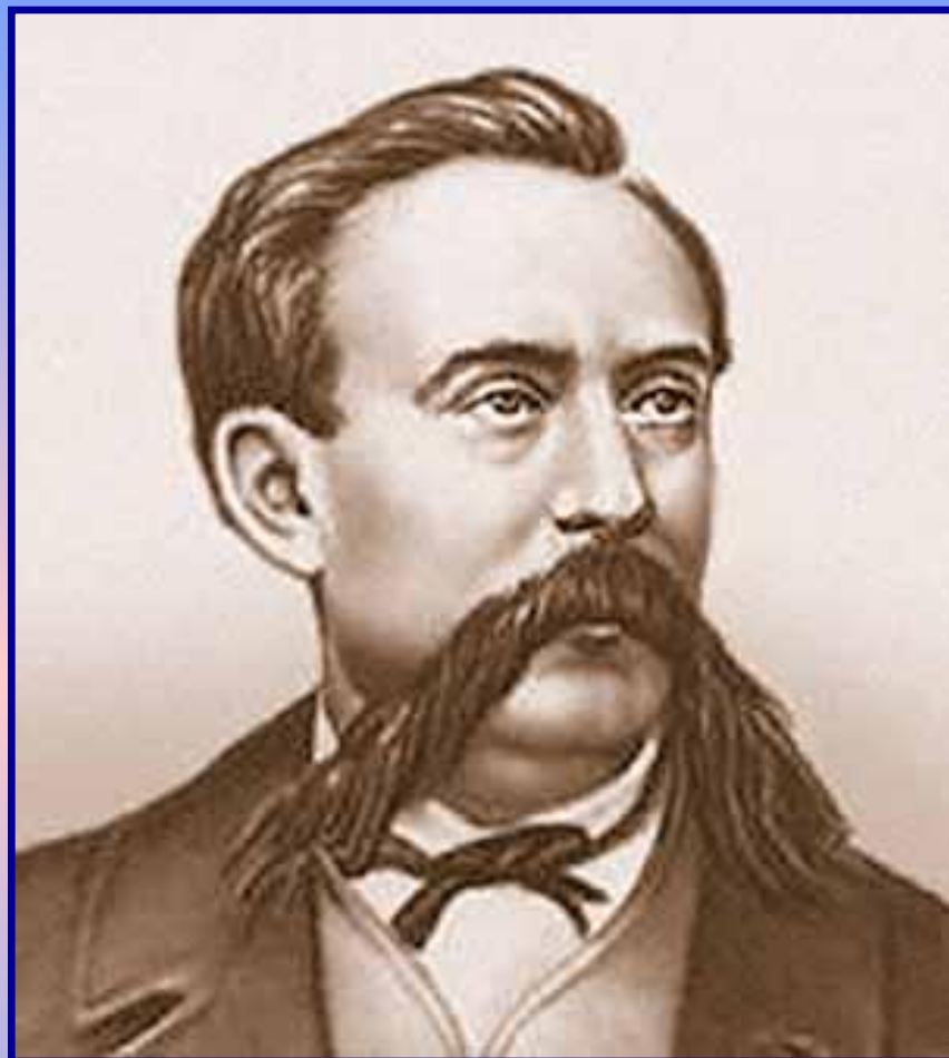
Профессор химии Зинин Николай Николаевич