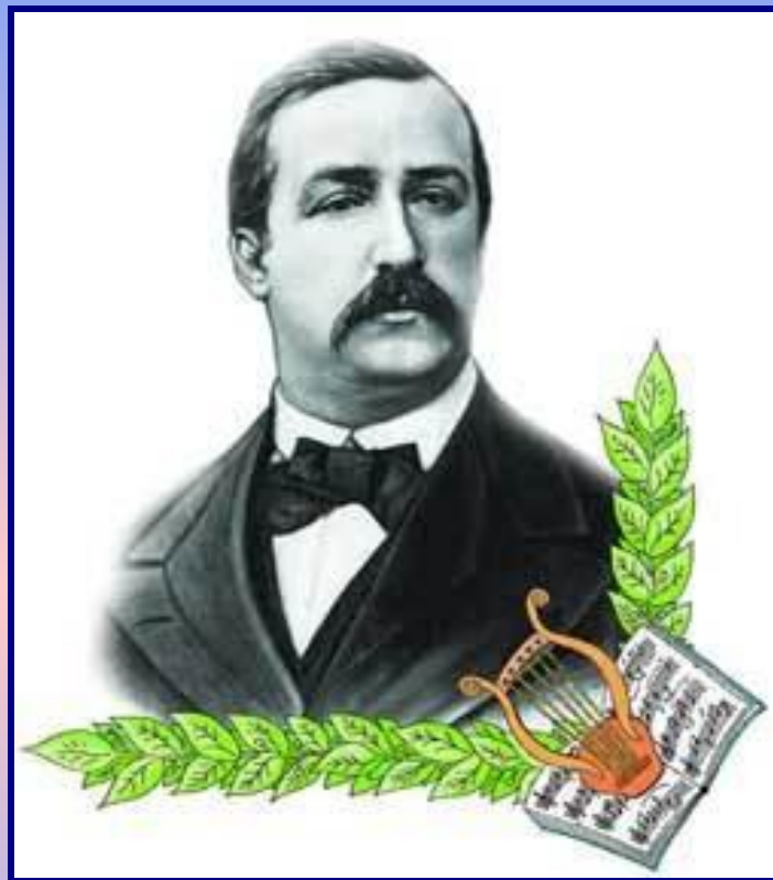
Александр Порфирьевич Бородин