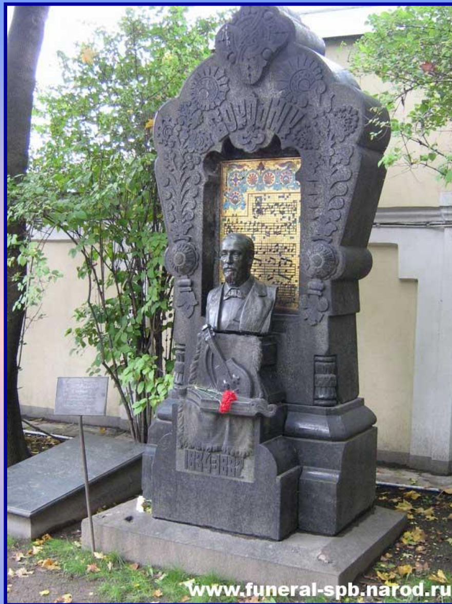
Памятник А.П. Бородину на Пескаревском кладбище Санкт - Петербурга