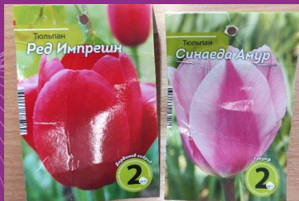
Луковицы гибридных тюльпанов -tulipa white spring