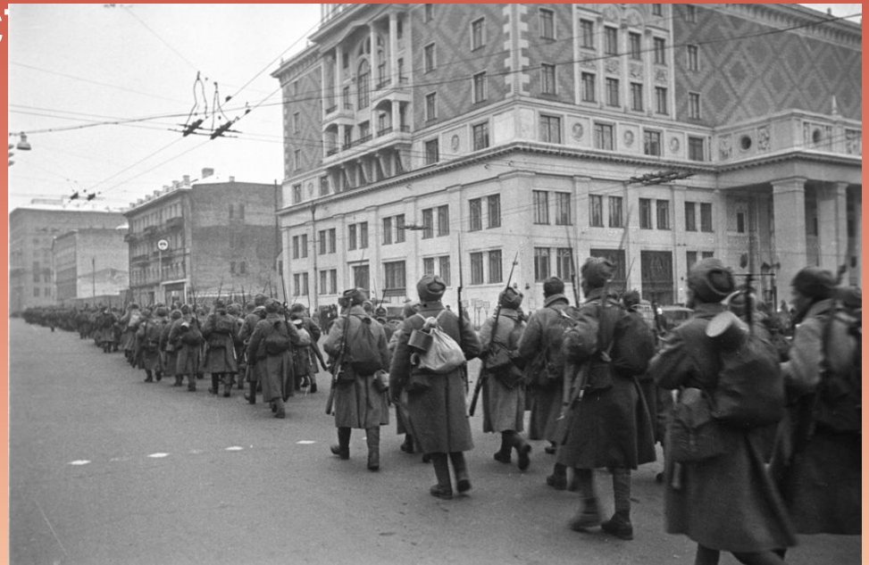
БИТВА ЗА МОСКВУ

Первая крупная победа красной армии над немецко-фашистскими войсками. В результате этой победы была устранена угроза захвата врагом территории Ярославской области