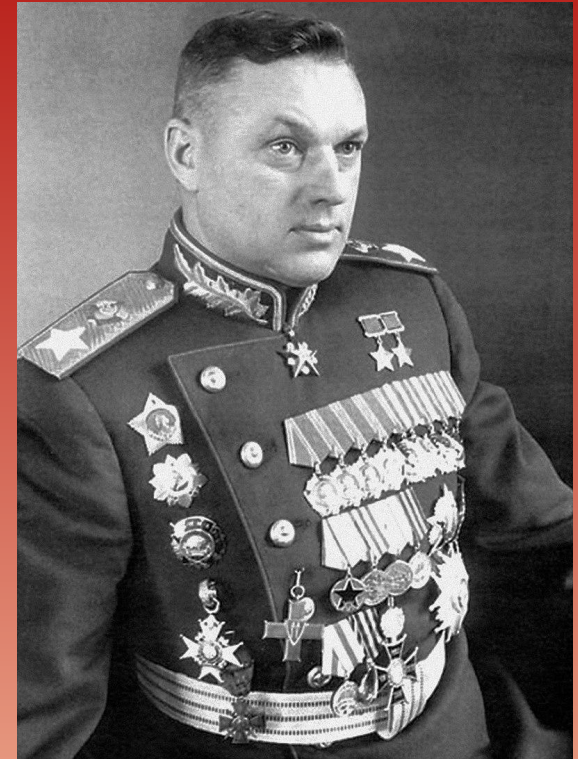
РОКОССОВСКИЙ КОНСТАНТИН КОНСТАНТИНОВ ИЧ

Назовите полководца, командовавшего Парадом победы 24 июня 1945 года в Москве