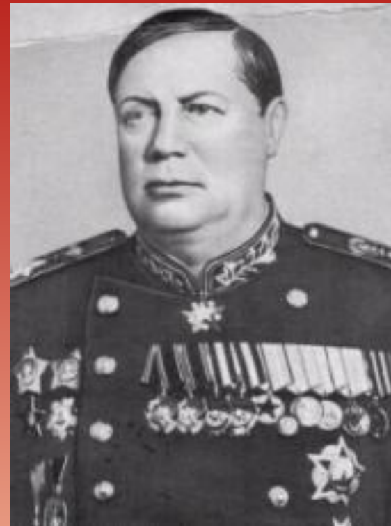
ТАЛБУХИН ФЁДОР ИВАНОВИЧ

Родился 16 июня 1894 года в деревне Андроники Ярославской губернии. Командовал 4-м, и 3-м Украинскими фронтами. Герой Советского Союза (7.05.1965). Единственный Маршал Советского Союза, удостоенный этой награды посмертно.