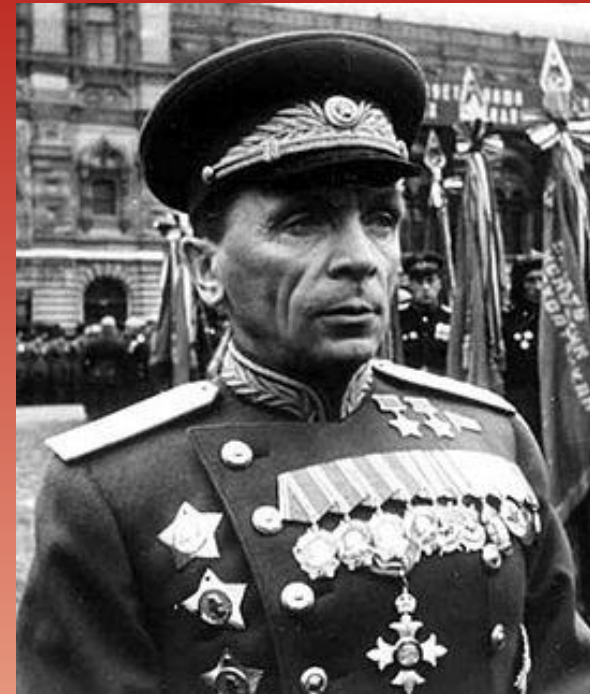
БАТОВ ПАВЕЛ ИВАНОВИЧ