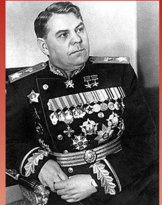
ВАСИЛЕВСКИ Й АЛЕКСАНДР МИХАЙЛОВИЧ

Назовите военачальника, занимавшего должность начальника Генерального штаба с 1942 по 1945 год. Он же во второй половине 1945 года являлся главнокомандующим советскими войсками на Дальнем Востоке в войне с Японией.