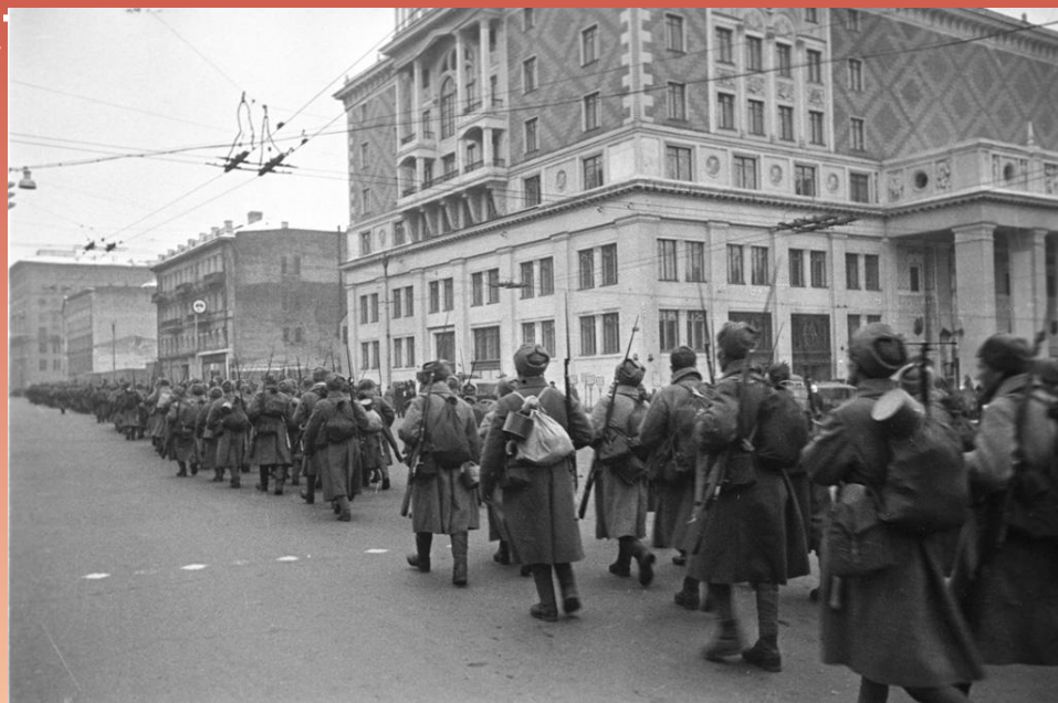
БИТВА ЗА МОСКВУ

Первая крупная победа красной армии над немецко-фашистскими войсками. В результате этой победы была устранена угроза захвата врагом территории Ярославской области