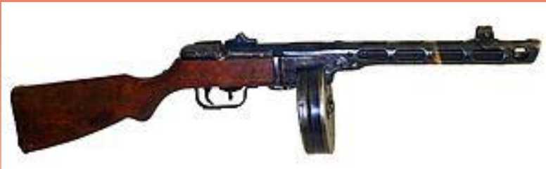
ППШ - ПИСТОЛЕТ- ПУЛЕМЁТ ШПАГИНА