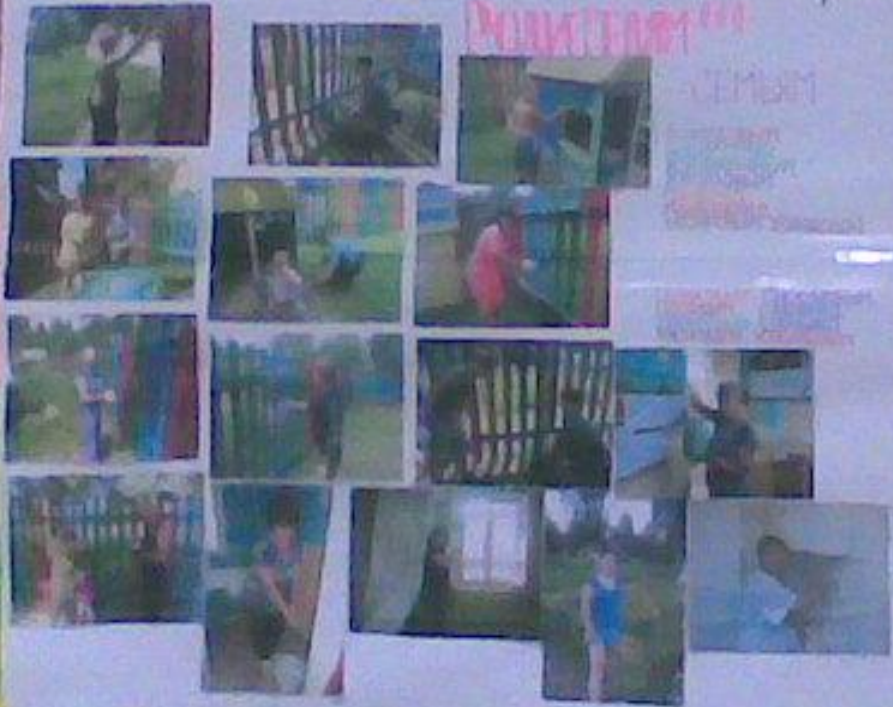
Фотовыставка уборка территории детского сада