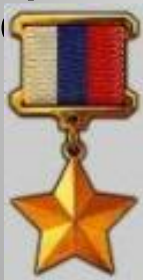
Золотая звезда Героя России