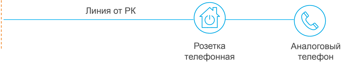
Схема подключения ПО по технологии FTTB/ETTH

Схема подключения традиционной телефонии