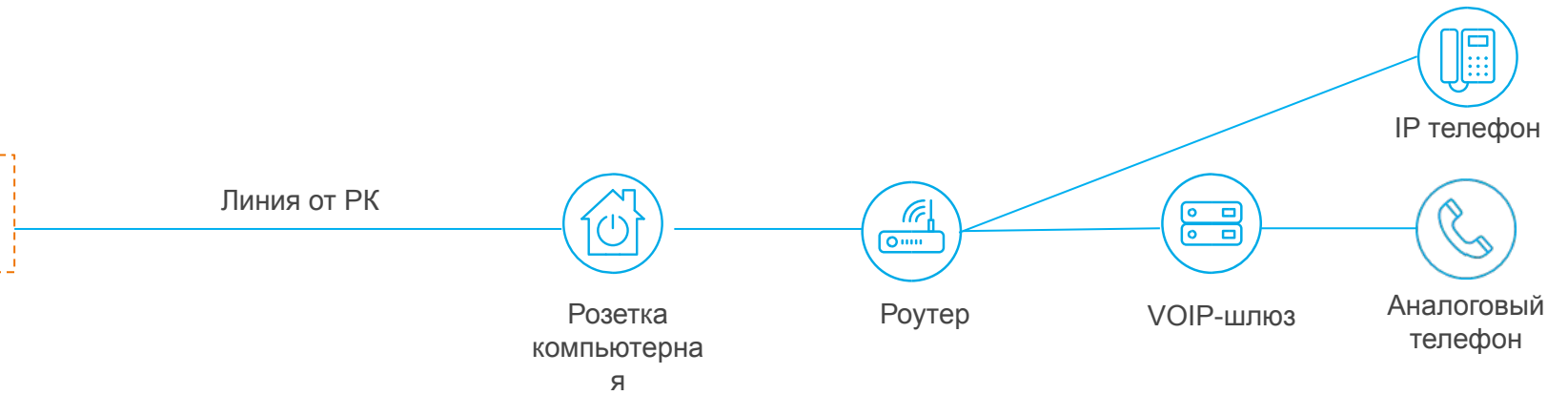
Схема подключения ПО по технологии PON/FTTH

Схема подключения ПО по технологии FTTB/ETTH