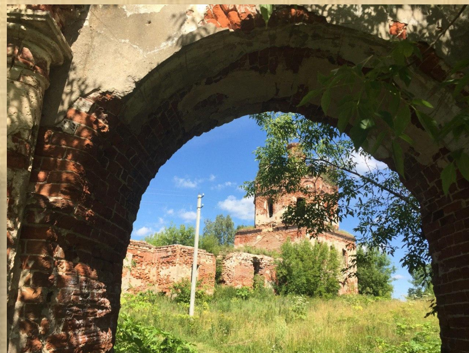
Храм Воскресения Христового 1748 г.