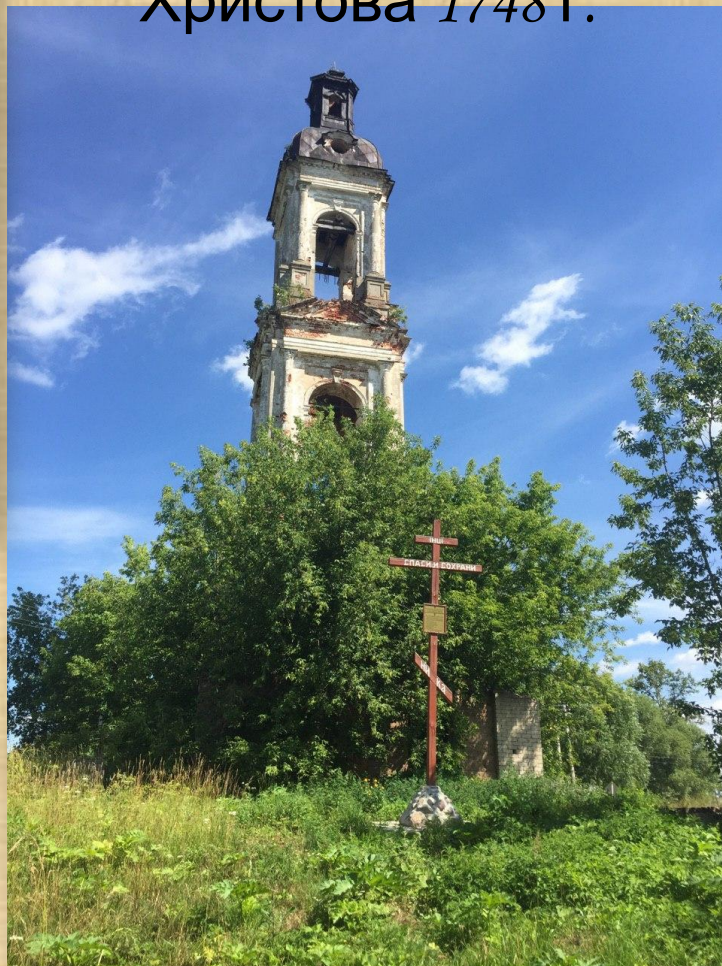
Колокольня храма Воскресения Христового 1748 г.