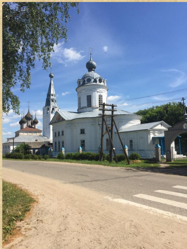
Храм Пресвятой Троицы (неизв.) и храм Рождества Пресвятой Богородицы 1808 г.