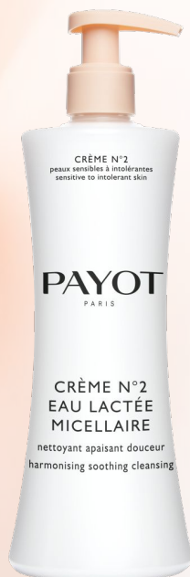
Очищающее средство без отдушек