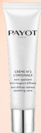
Успокаивающее средство локального действия