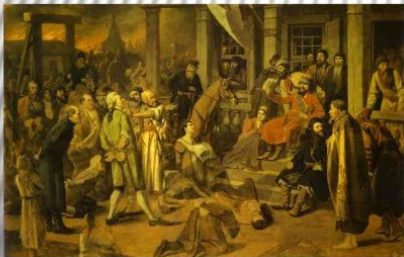
Восстание Е.И. Пугачева

1773 – весна 1774 г. – осада Яицкого городка; продвижение к Оренбургу. Весна 1774 г. – поражение; отступление на Урал; восстановление сил, взятие крепости Магнитная, Ижевского и Воткинского завод.