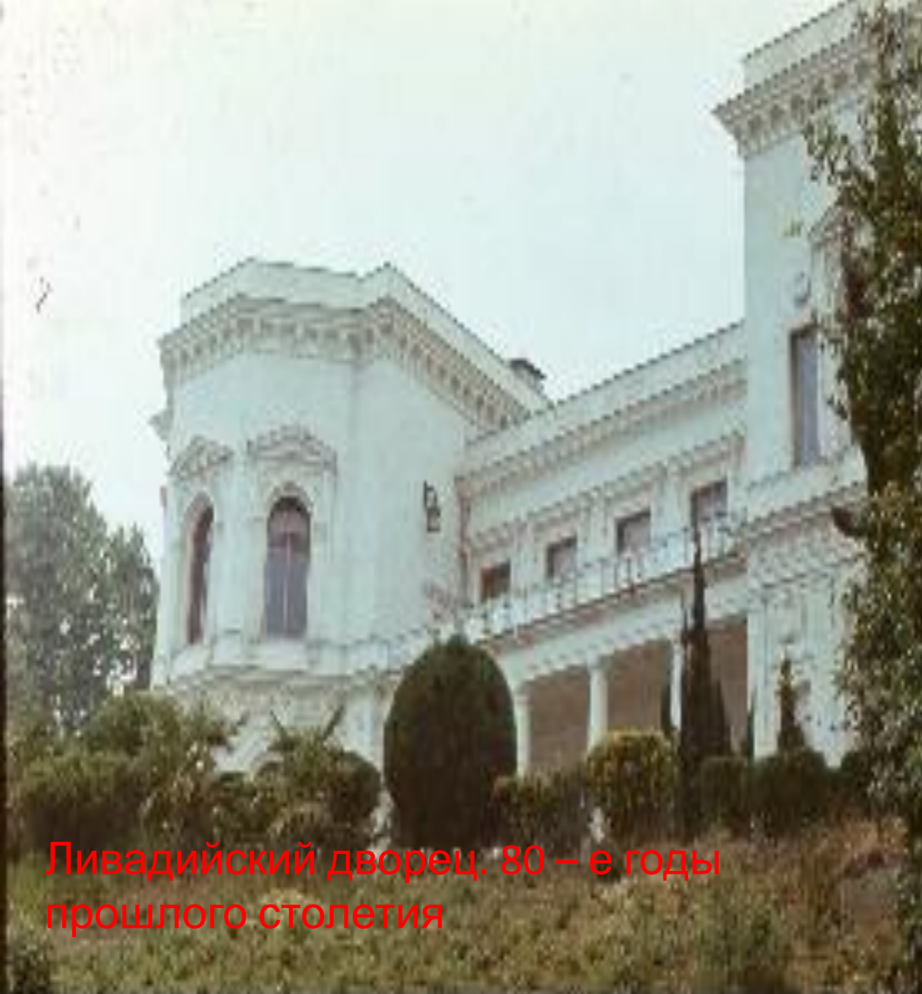
Ливадийский дворец. 80 – е годы прошлого столетия