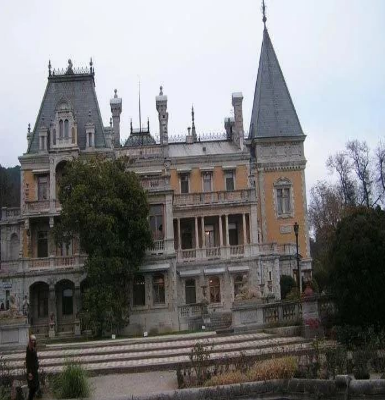
Масандровский дворец. Советский период