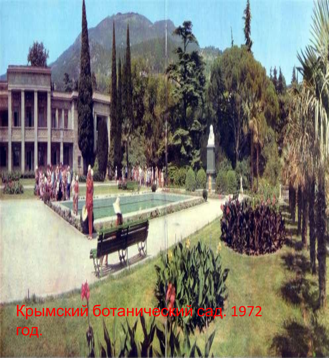
Крымский ботанический сад. 1972 год.