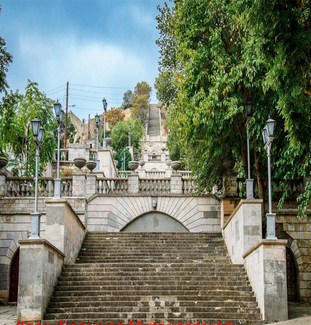
Керч. Большая Митридатская лестница. Прошлое