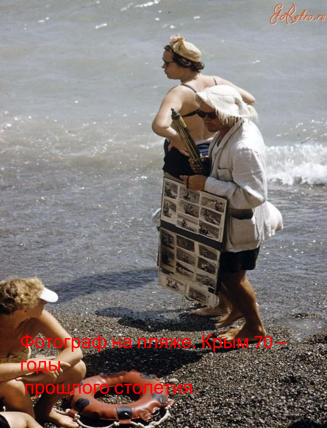
Фотограф на пляже. Крым 70 – годы прошлого столетия.