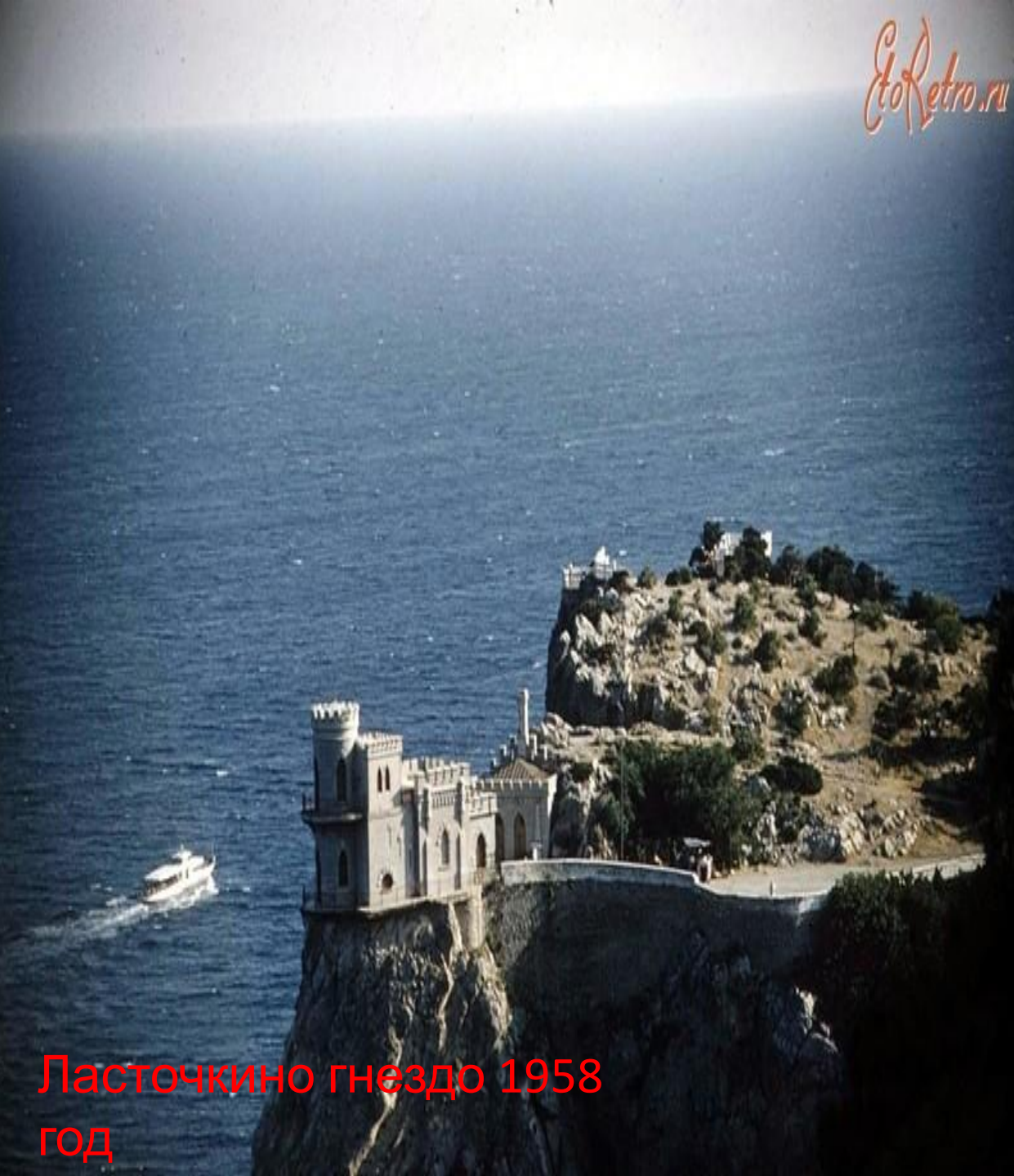
Ласточкино гнездо 1958 год