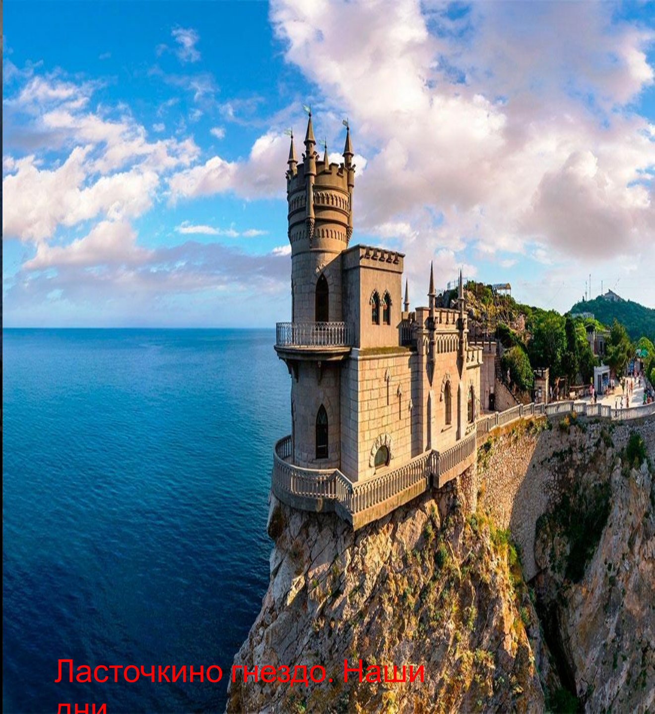
Ласточкино гнездо. Наши дни