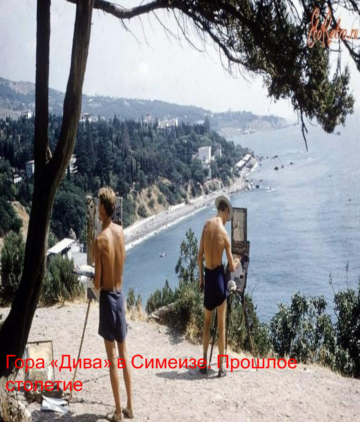
Гора «Дива» в Симеизе. Прошрое столетие