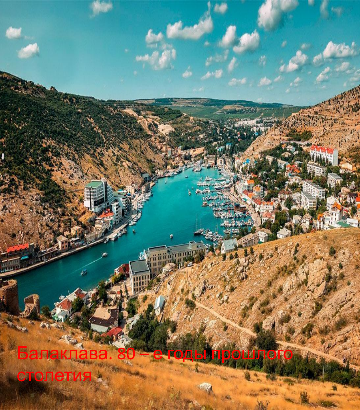
Балаклава. 80 – е годы прошлого столетия