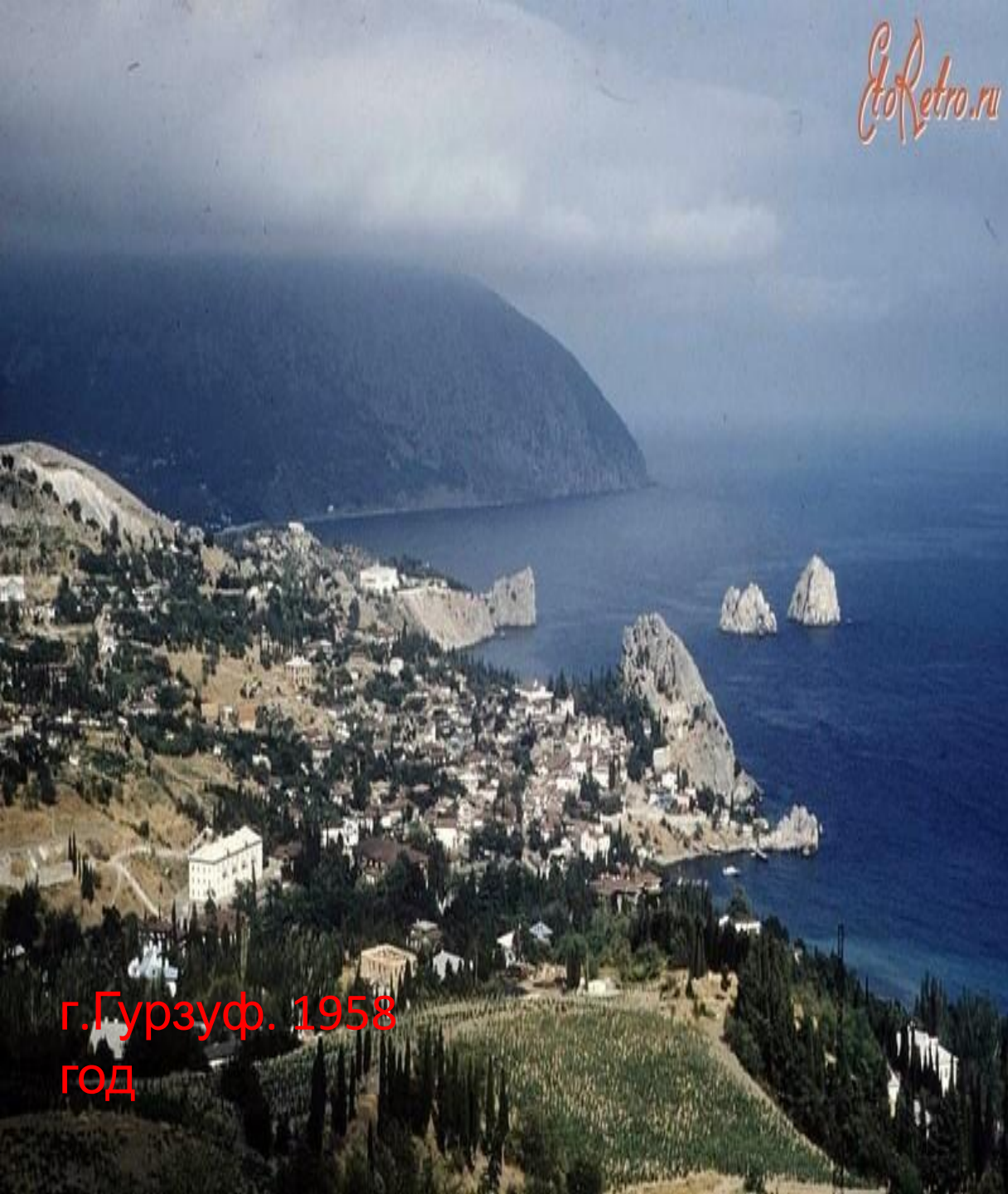
г.Гурзуф. 1958 ГОД