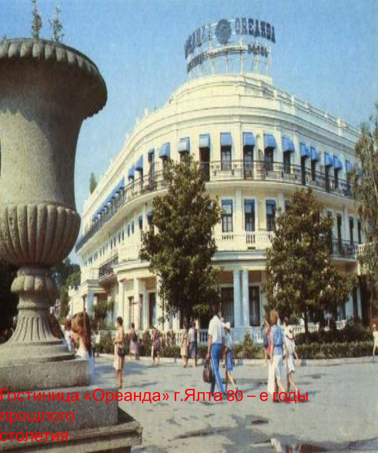
Гостиница «Ореанда» г.Ялта 80 – е годы прошлого столетия