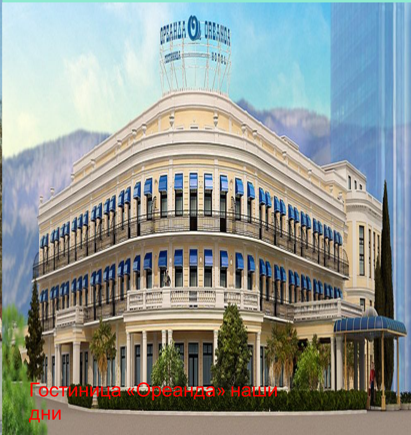
Гостиница «Ореанда» наши дни