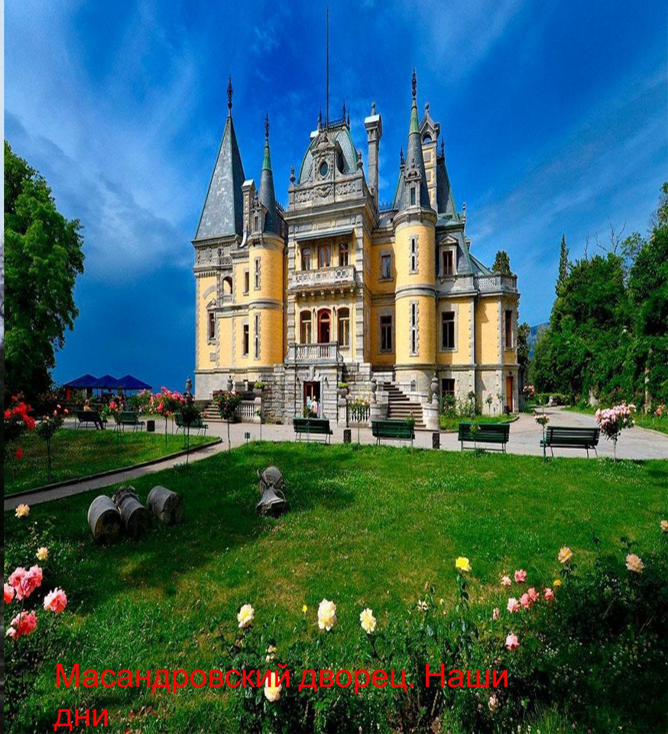
Масандровский дворец. Наши дни