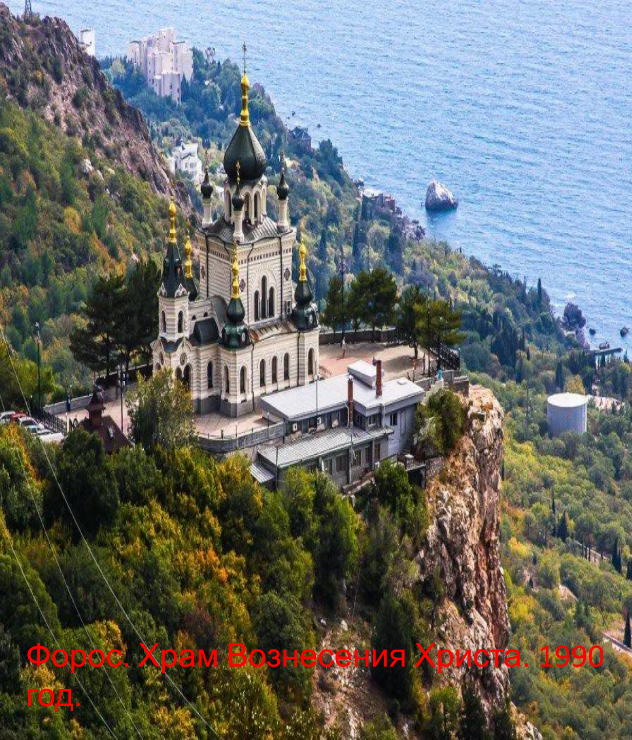
Форос. Храм Вознесения Христа. 1990 год.