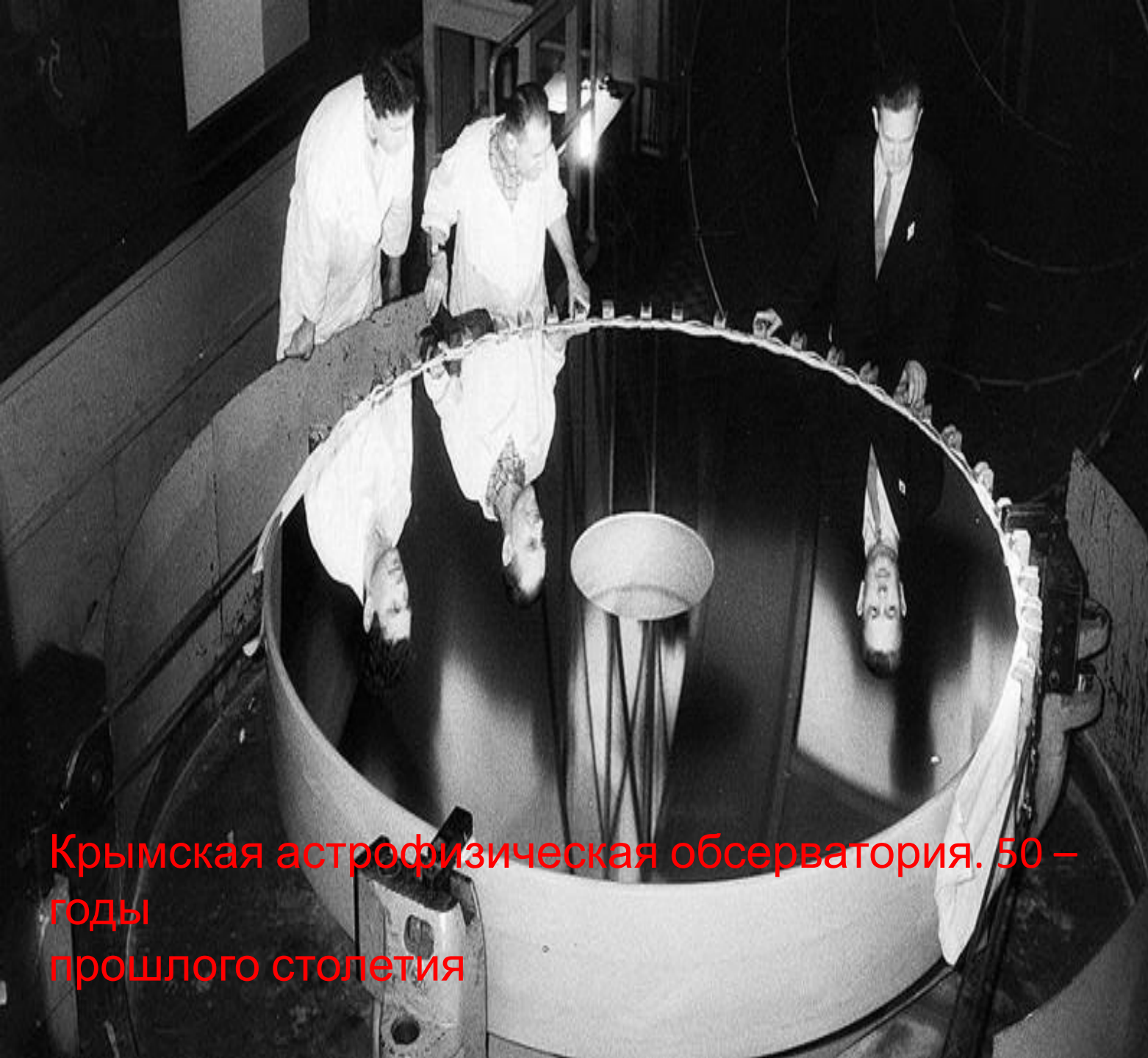
Крымская астрофизическая обсерватория. 50 – годы прошлого столетия