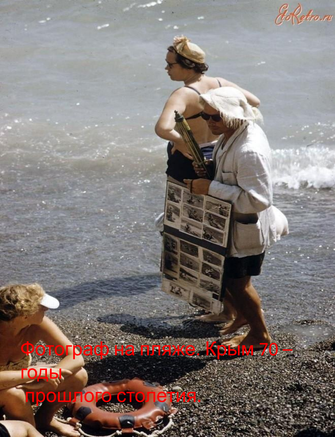
Фотограф на пляже. Крым 70 – годы прошлого столетия.