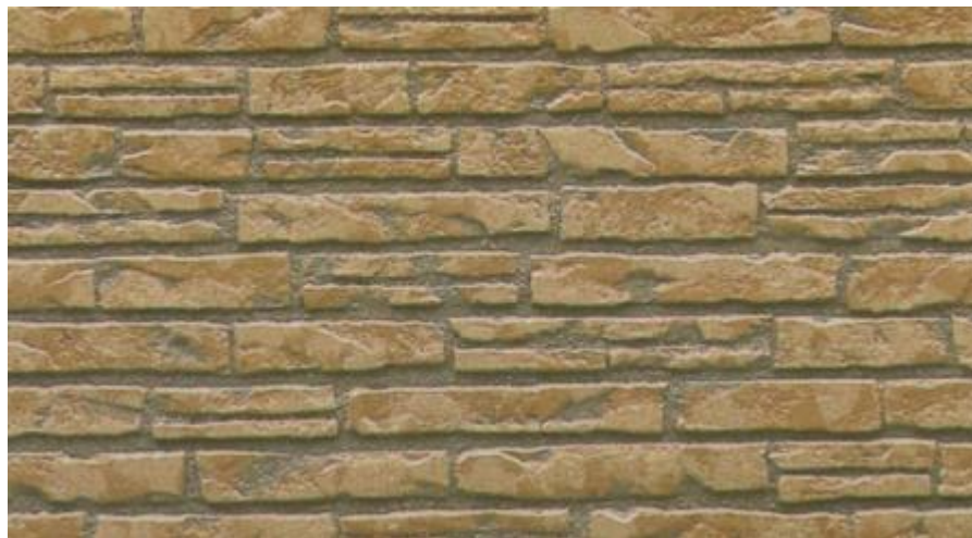
Тип текстуры: камень