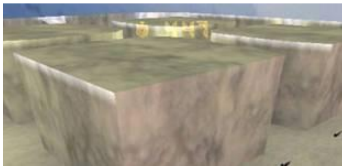
Тип текстуры: мрамор