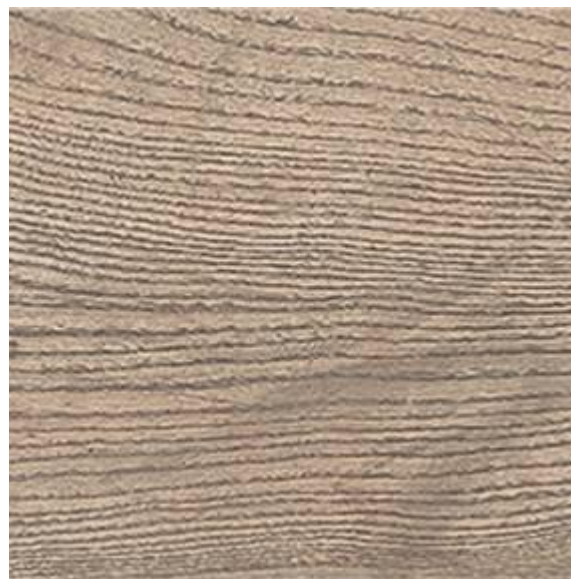
Доска , имитирующая текстуру натурального дерева