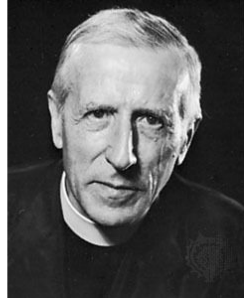
Пьер Тейяр де Шарден Один из создателей теории ноосферы