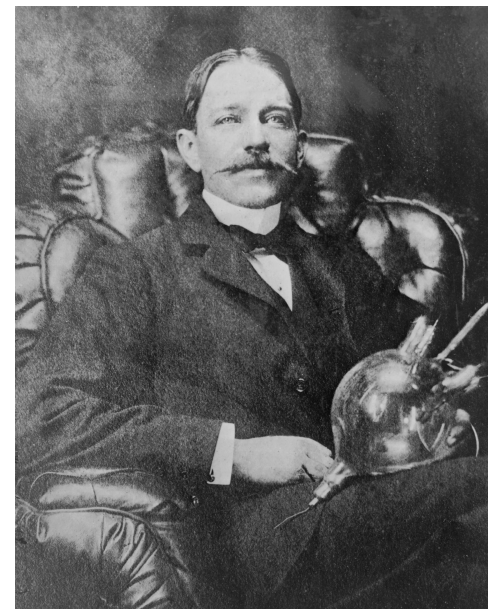
Питер Купер Хьюитт