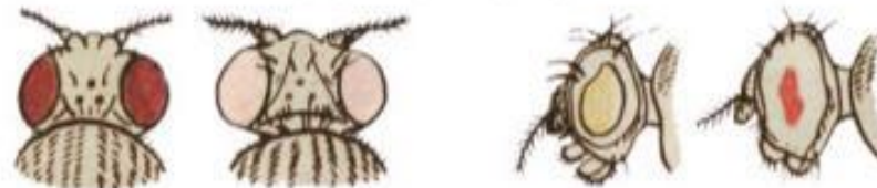
Изменение формы и пигментации глаз