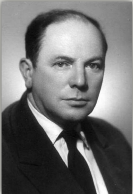
Л. Канторович Немчинов

В 1950-е годы в стране произошло широкое проникновение в науку математических методов, что привело к появлению принципиально новой теории — оптимального планирования народного хозяйства, большой вклад в становление которой внесли многие ученые, но в первую очередь это: