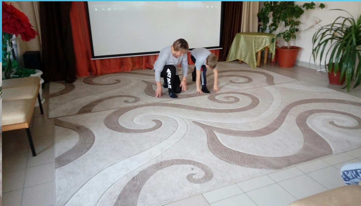
Низкий старт и разбег