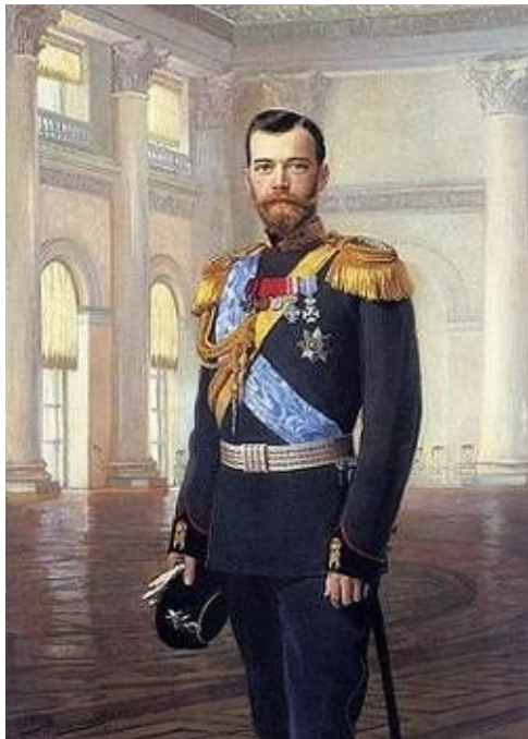
Император Российской Империи Николай II