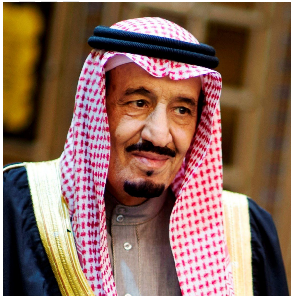
Король Саудовской Аравии Салман ибн Абдул-Азиз Аль Сауд