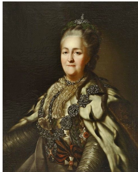
Императрица Российской Империи Екатерина II