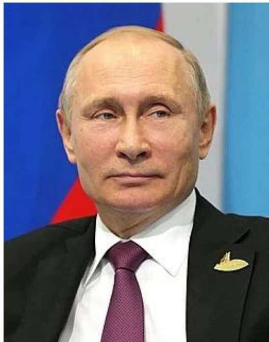
Президент Российской Федерации Владимир Путин