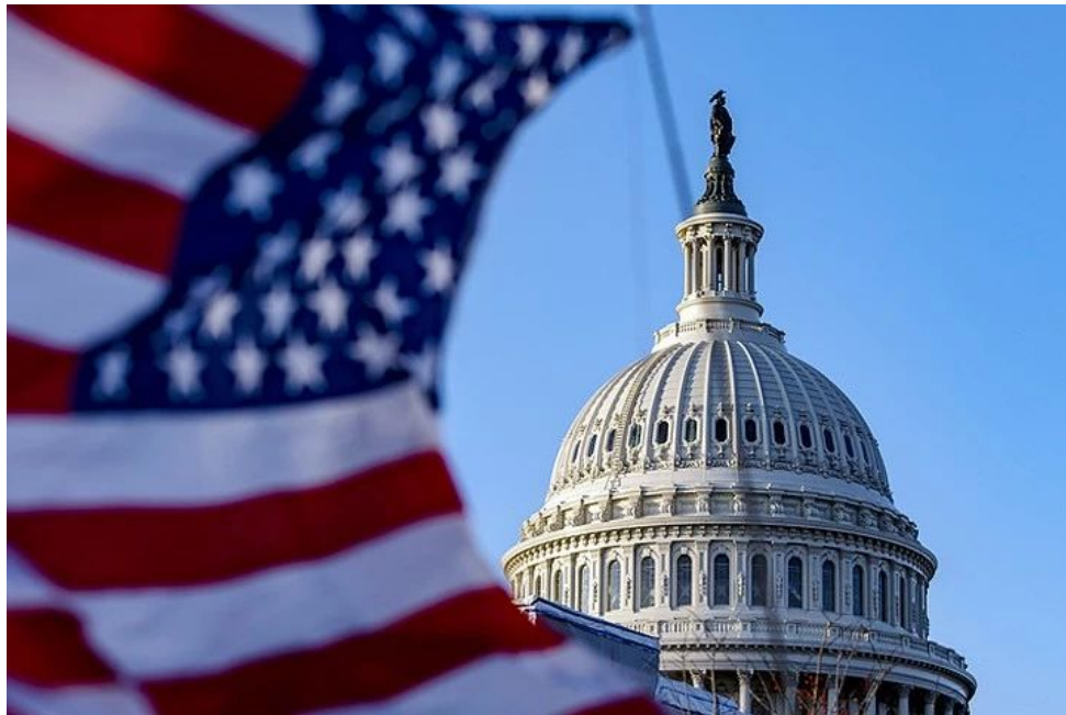
Соединенные Штаты Америки