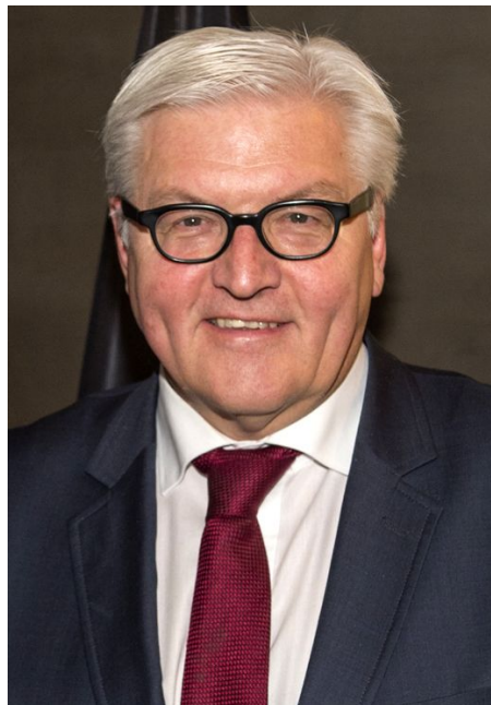
Президент Германии Франк-Вальтер Штайнмайер