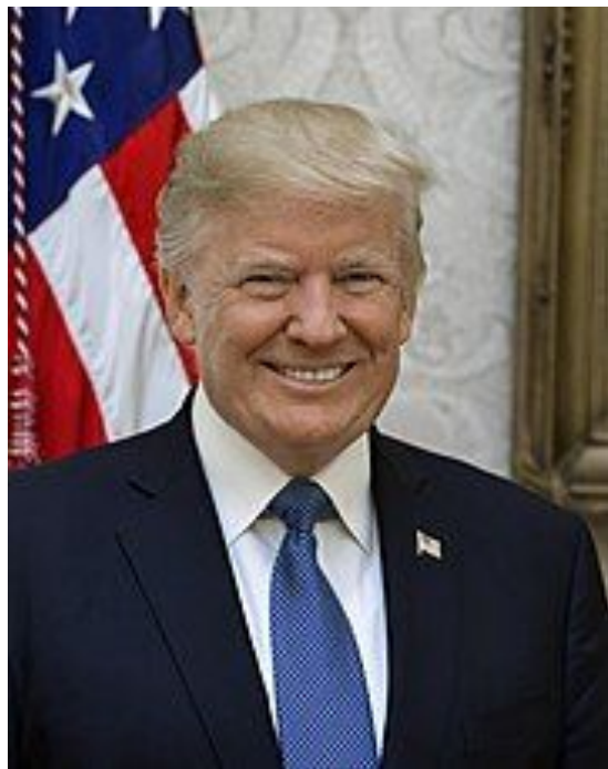
Президент США Дональд Трамп