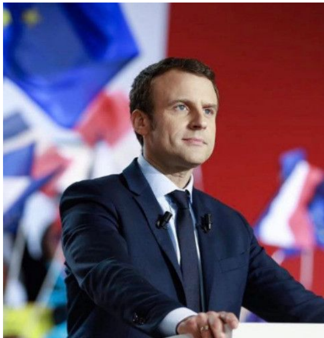
Президент Франции Эмманюэль Макрон