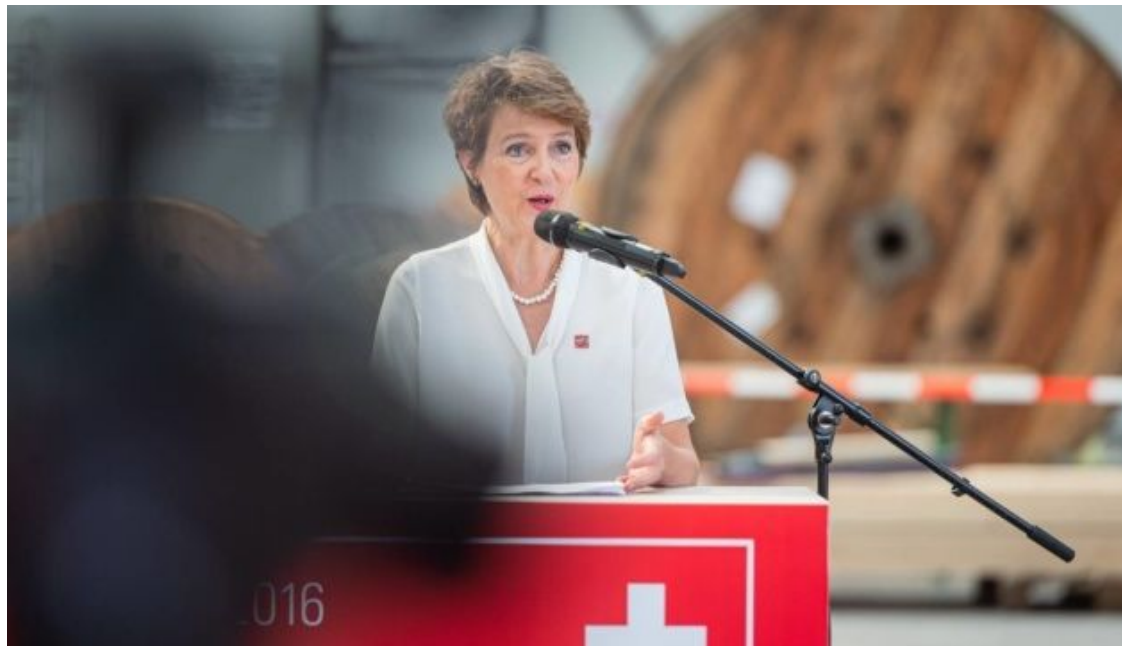
Президент Швейцарии Симонетта Соммаруга