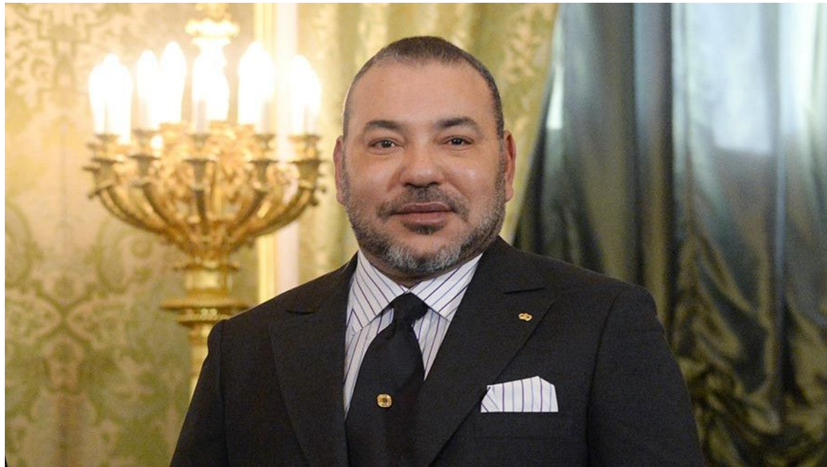
Король Марокко Мухаммед VI