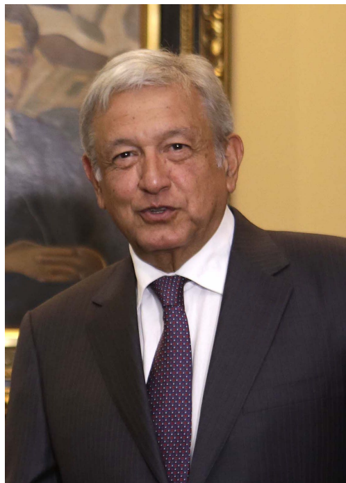
Президент Мексики Андрес Мануэль Лопес Обрадор