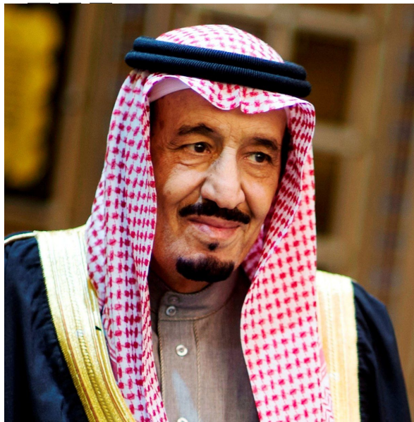
Король Саудовской Аравии Салман ибн Абдул-Азиз Аль Сауд