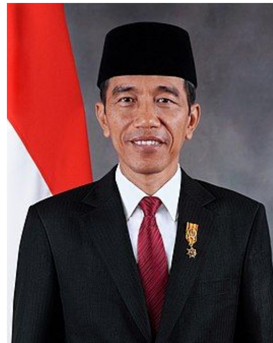
Президент Индонезии Джоко Видодо