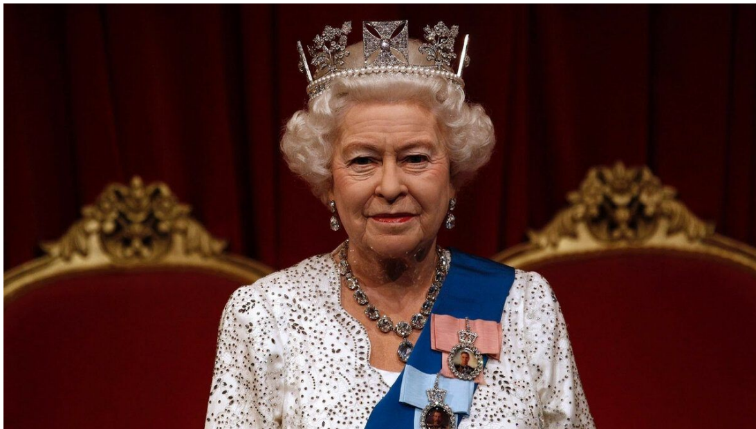
Королева Великобритании Елизавета II