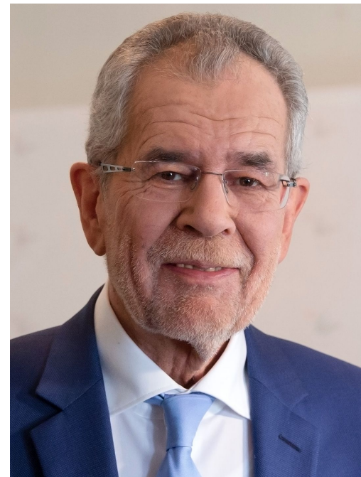
Президент Австрии Александр Ван дер Беллен