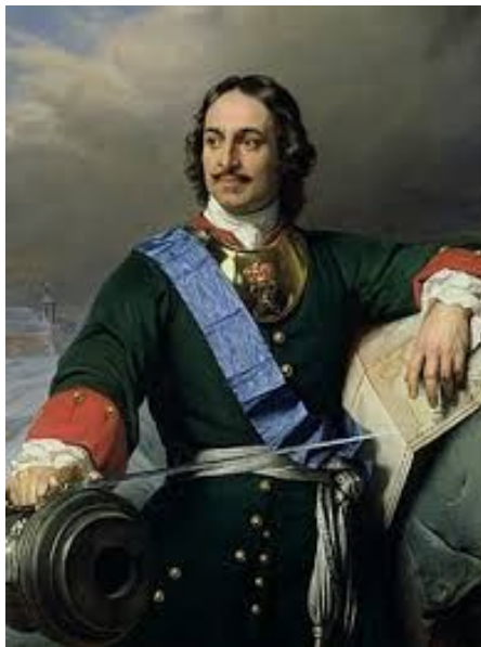
Император Российской Империи Петр I