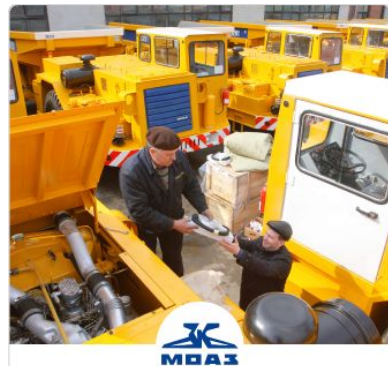
«Могилевский автомобильный завод имени С.М.Кирова»