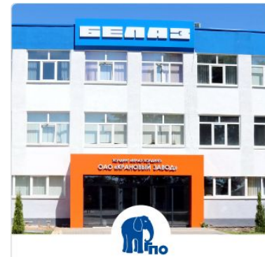
ОАО «Крановый завод»