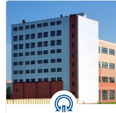
ОАО «Завод приборов автоматического контроля»