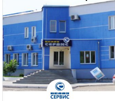
ОАО «БелАЗ- Сервис»