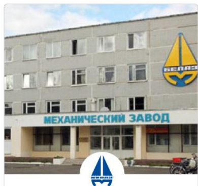
ОАО «Стародорожский механический завод»