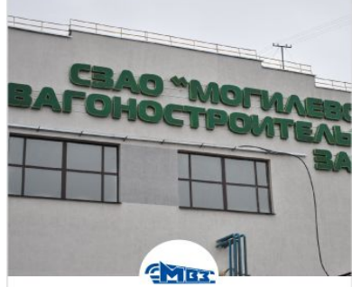
СЗАО «Могилевский вагоностроительный завод»