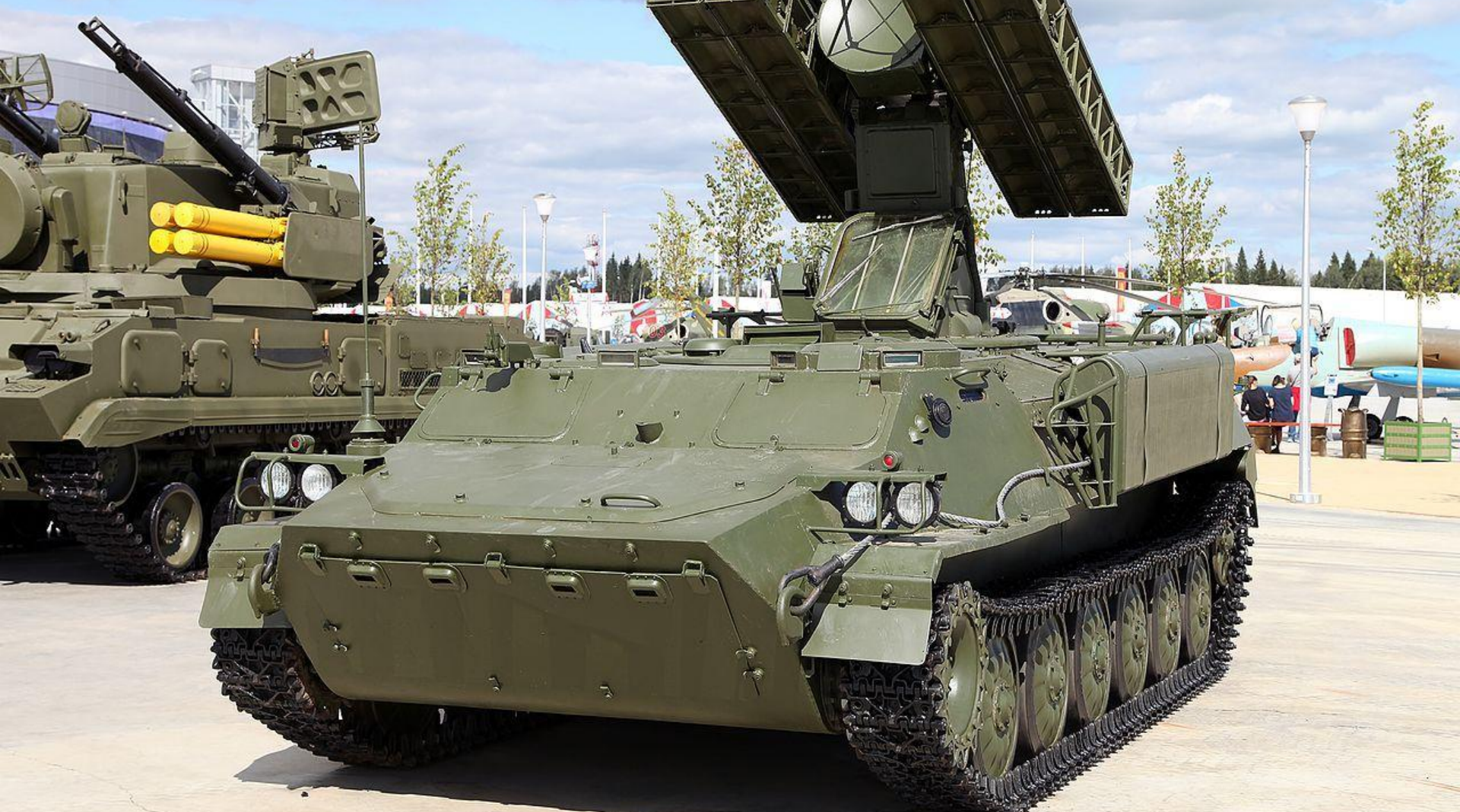
Зенитно-ракетный комплекс 9К35М3 Strela-10М3