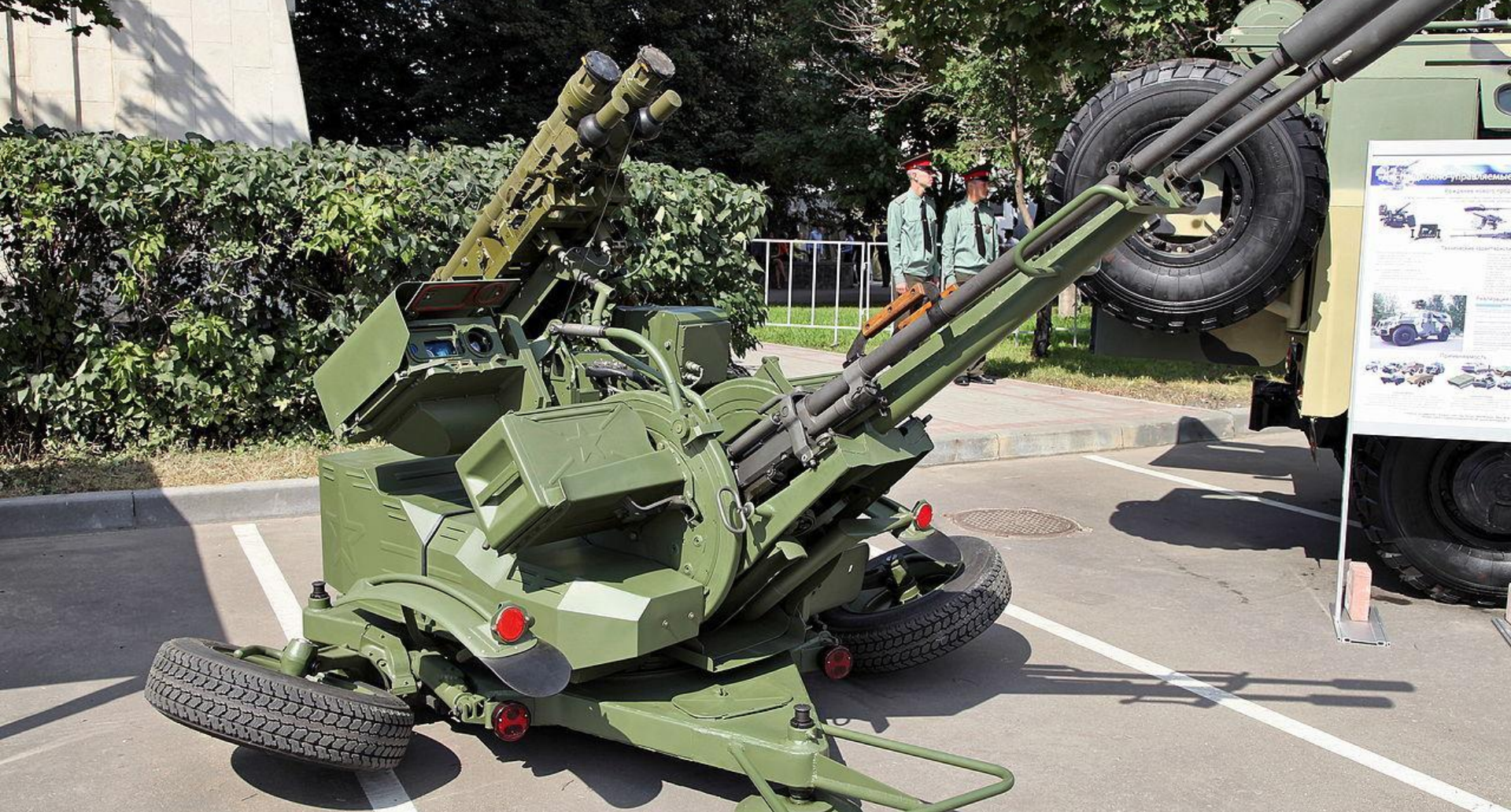
БУКСИРУЕМАЯ ЗЕНИТНАЯ УСТАНОВКА ЗУ-23/30 М1-3.