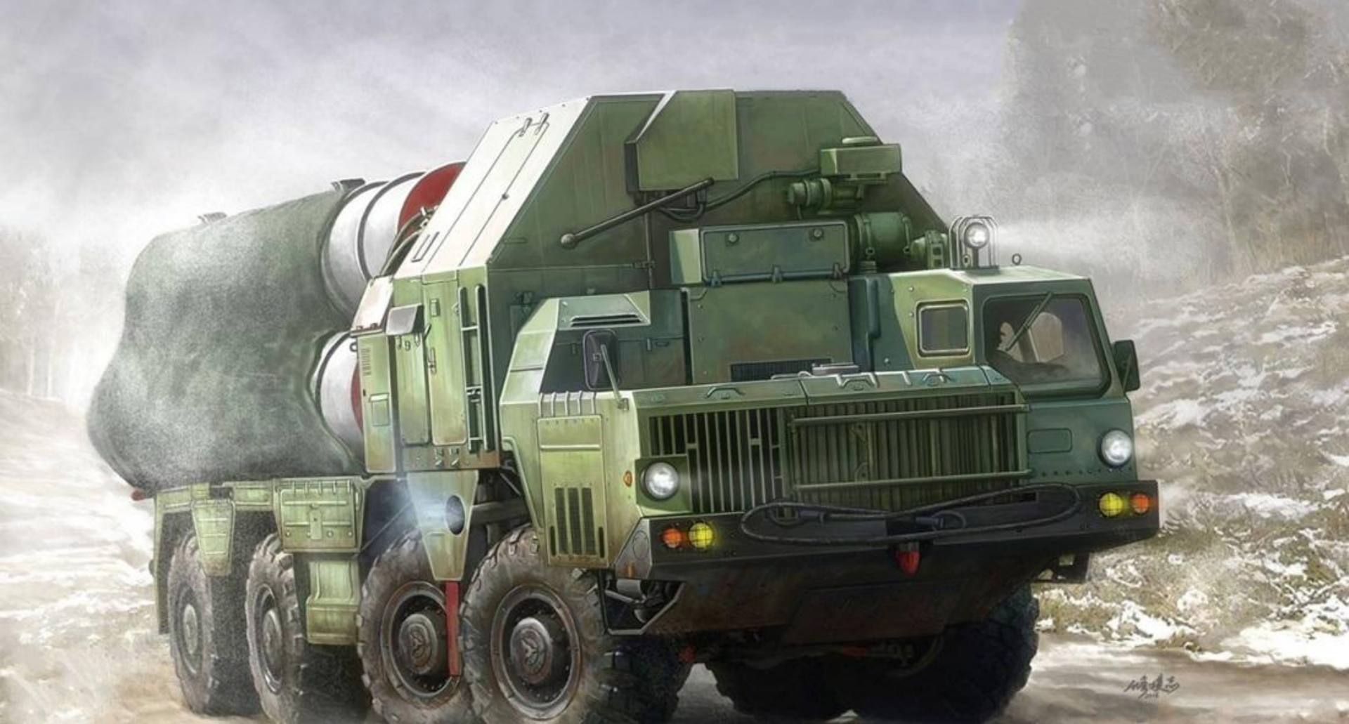
ЗЕНИТНО-РАКЕТНЫЙ КОМПЛЕКС "С-300"