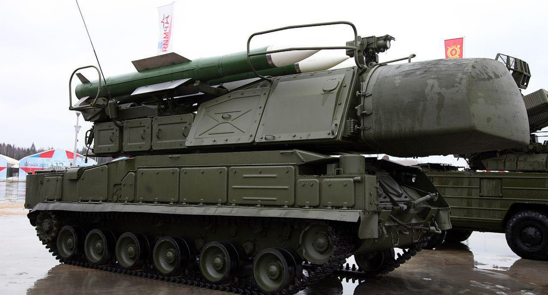
ЗЕНИТНО-РАКЕТНЫЙ КОМПЛЕКС 9А310М1-2 TELAR from Buk-M1-2 system