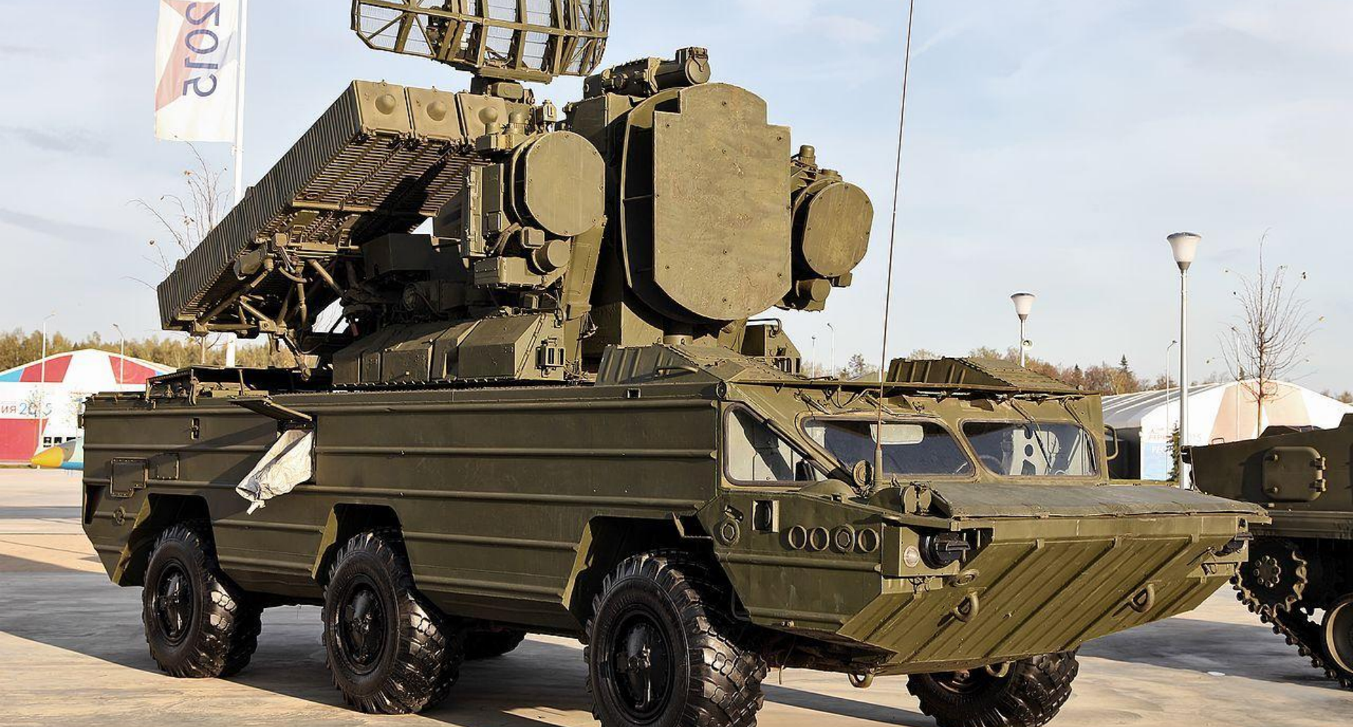
ЗЕНИТНО-РАКЕТНЫЙ КОМПЛЕКС 9А33ВМЗ TELAR from Osa-AKM system