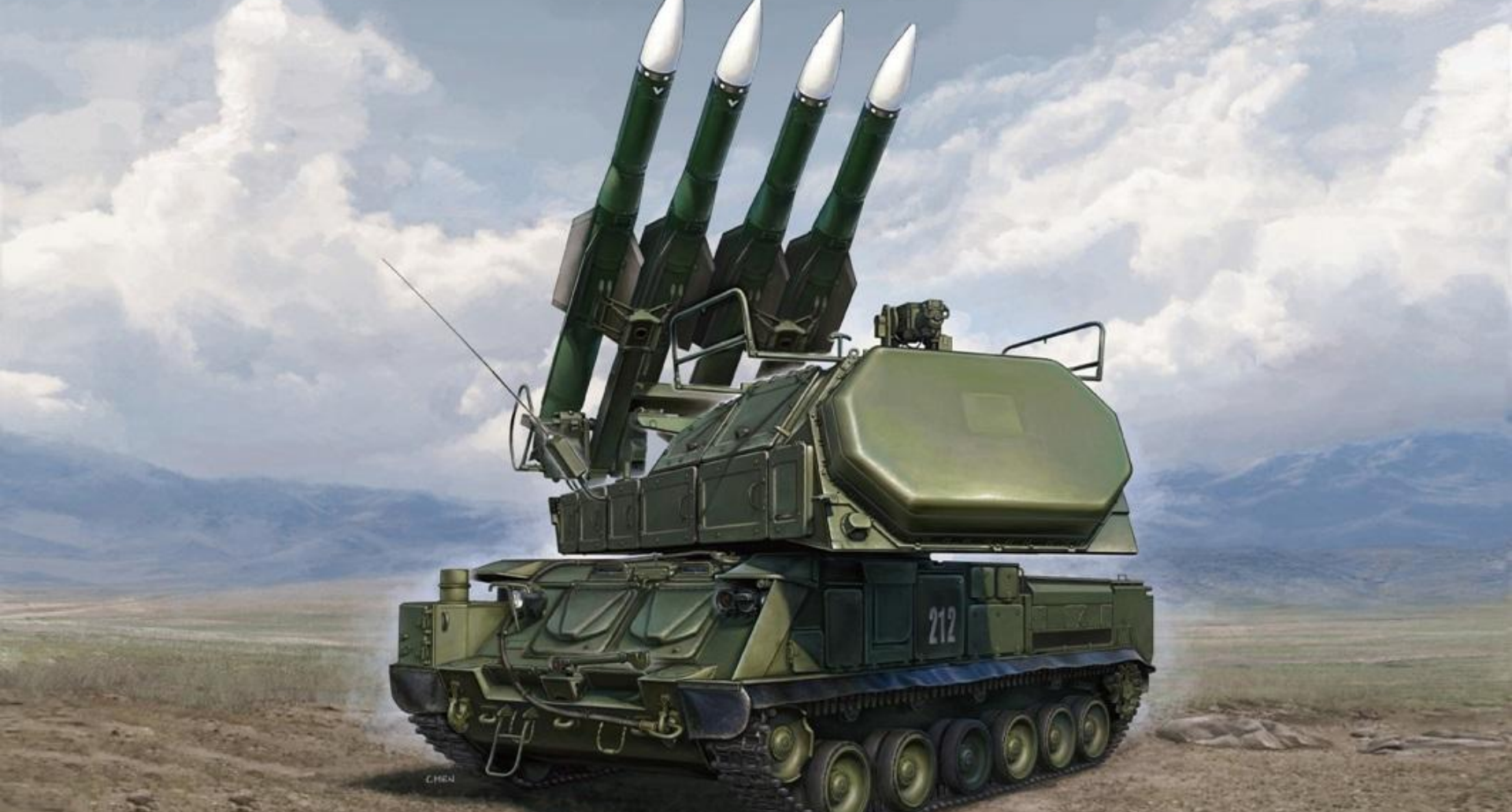
ЗЕНИТНО-РАКЕТНЫЙ КОМПЛЕКС 9К37 "БУК"