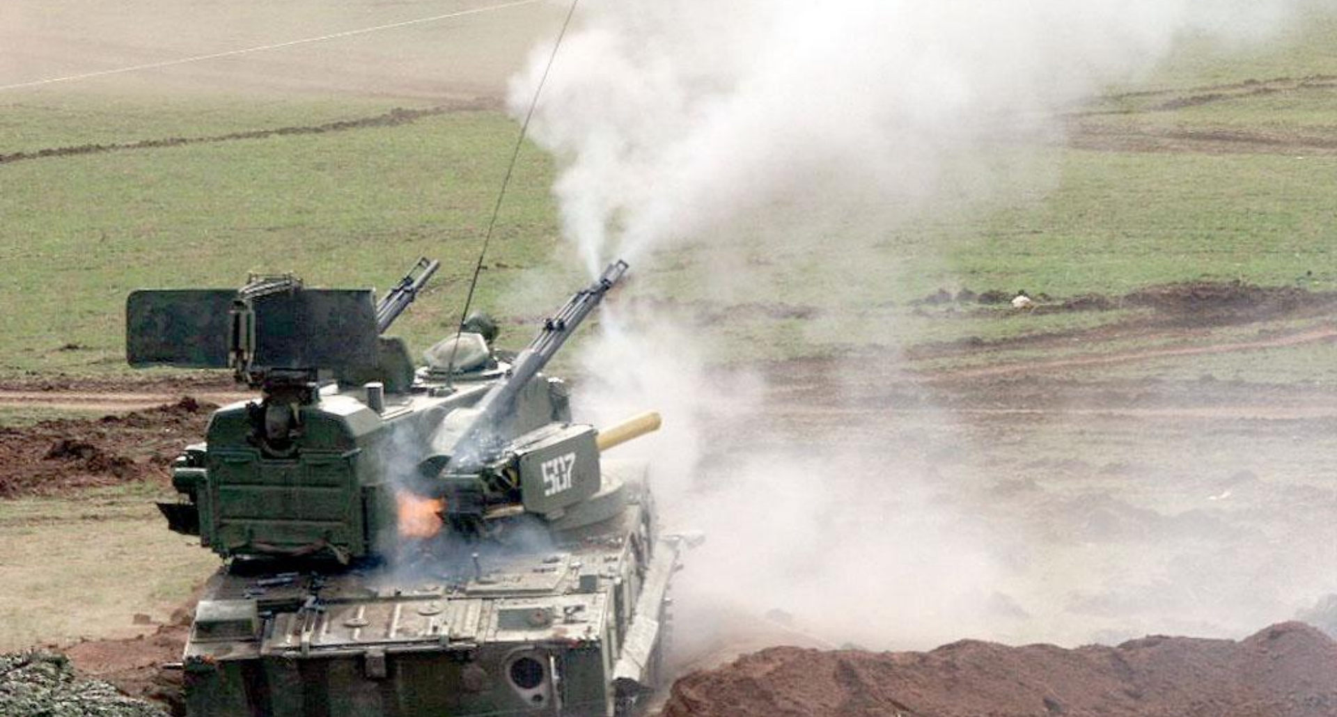
ЗЕНИТНАЯ САМОХОДНАЯ УСТАНОВКА 2С6 "ТУНГУСКА"