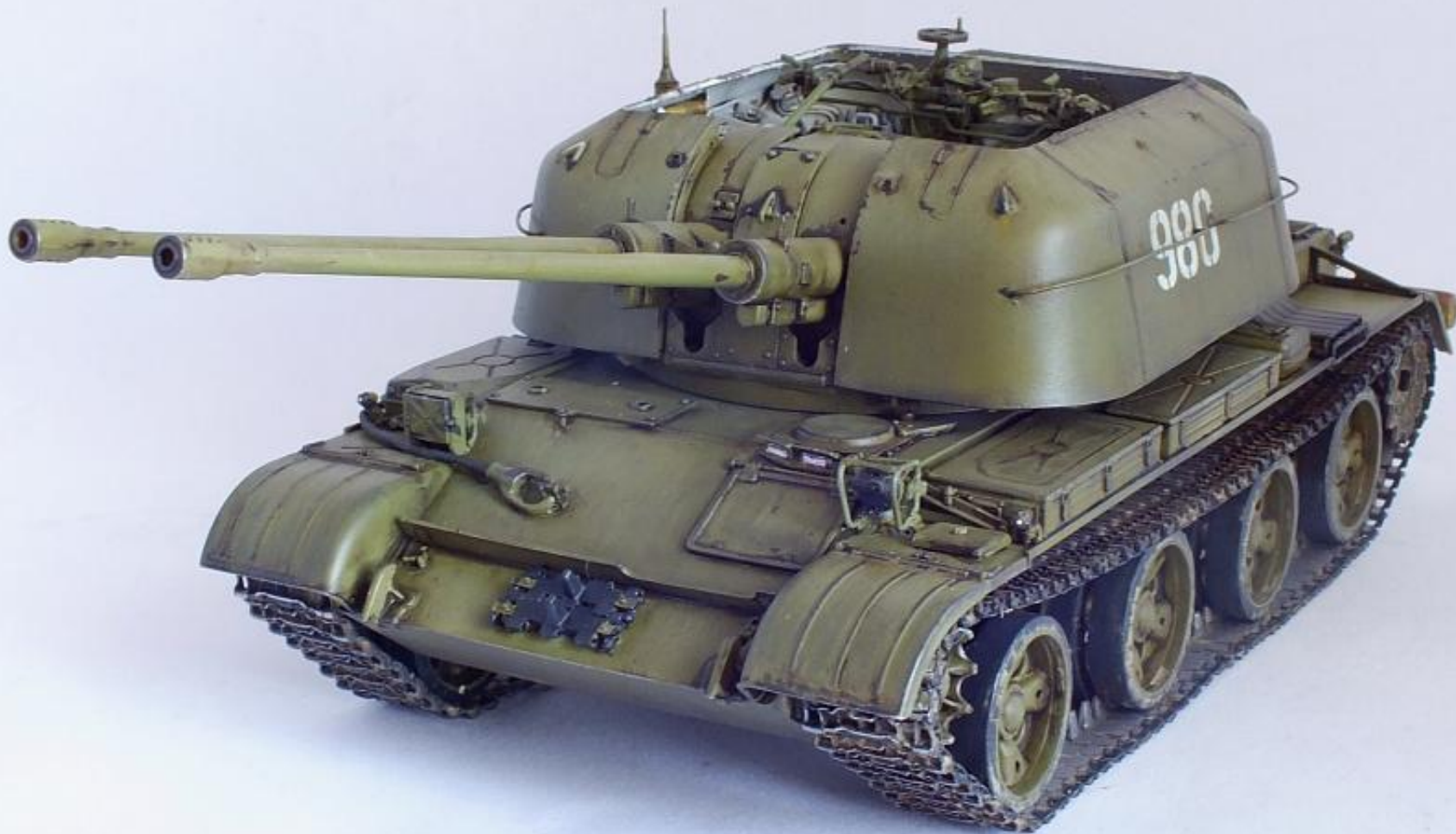
Зенитная самоходная установка ЗСУ-57-2