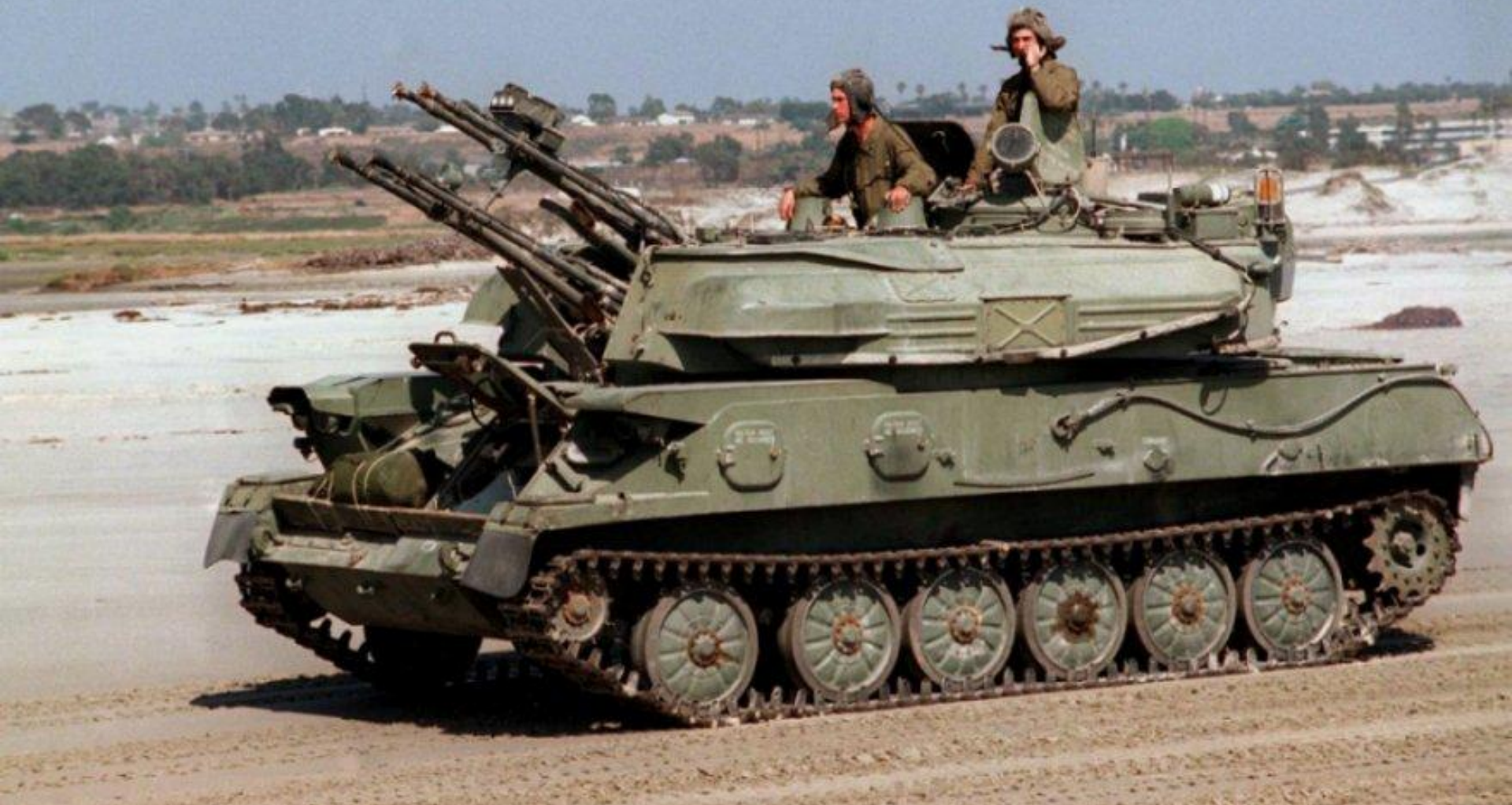
ЗЕЛЕНАТА АМФОБИЧНАТА СТАНОВКА БМП-1 "ШИЛКА"