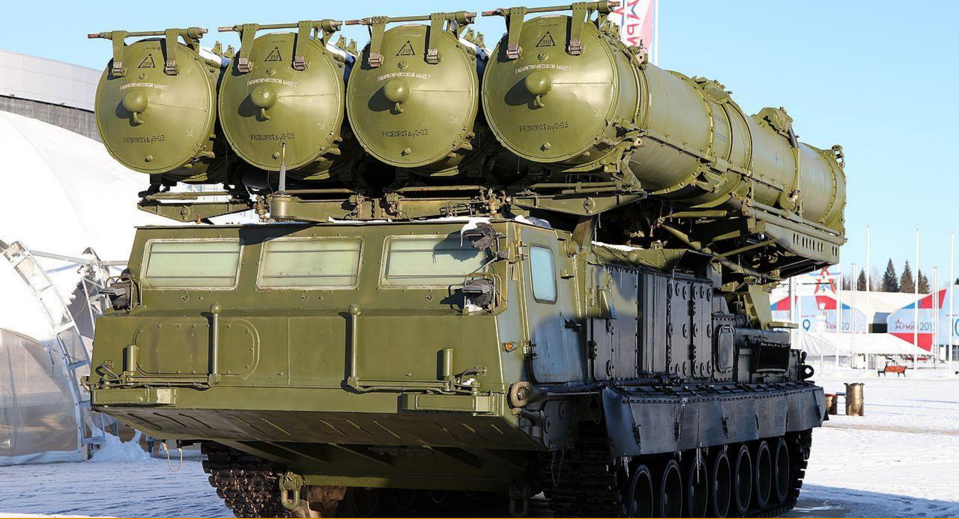
ЗЕНИТНО-РАКЕТНЫЙ КОМПЛЕКС 9А83 TELAR for S-300V system