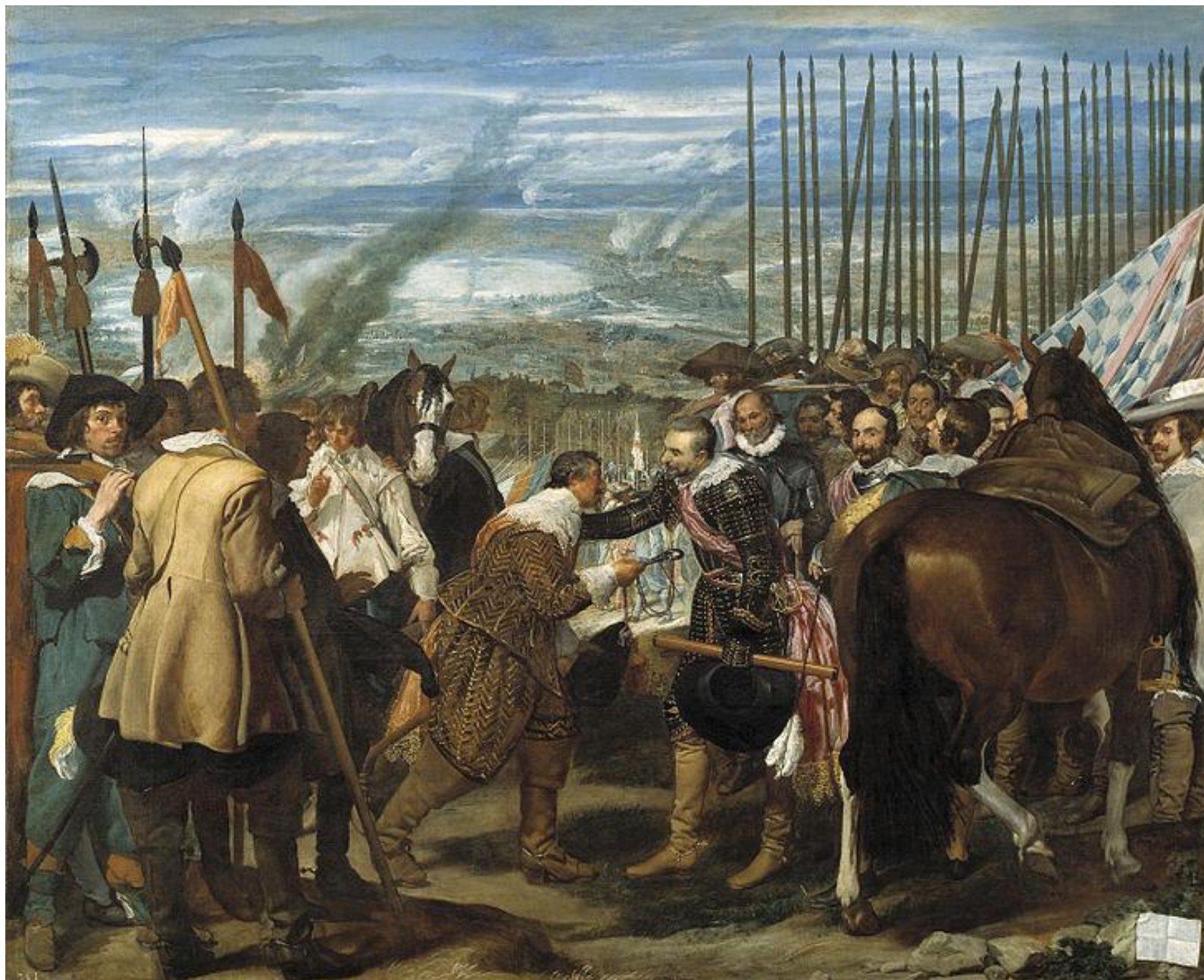
Диего Веласкес «Сдача Бреды».