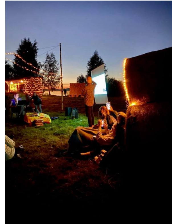
Форум «Ночи над Волгой 2020»