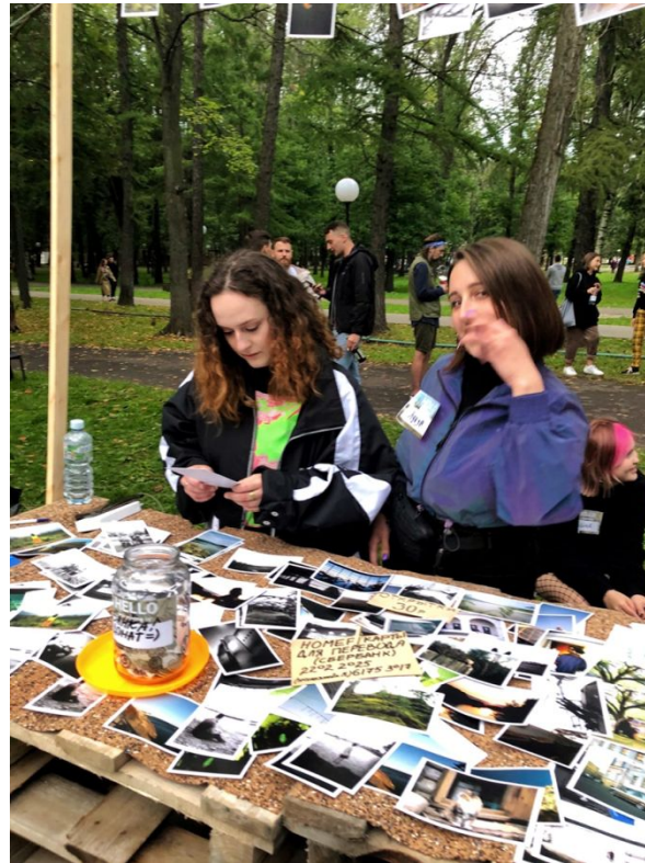
Ярославль, Groovy event 2020