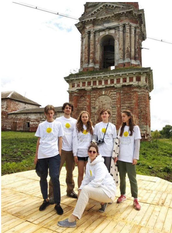
Курба, Арт-экспедиция 2019