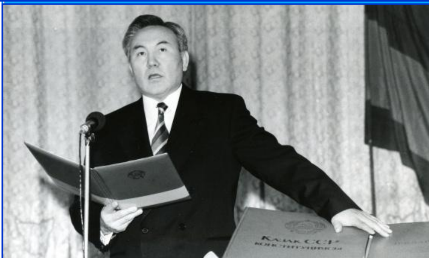
Присяга Президента КазССР