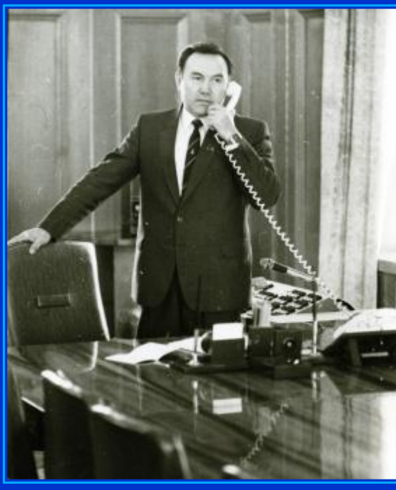
Председатель Совета Министров

Начиналась новая эпоха независимого Казахстана.