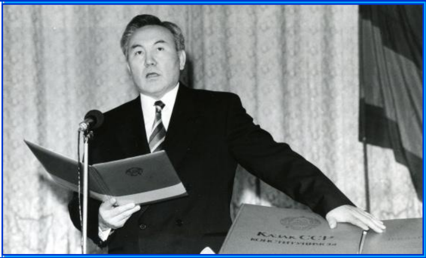
Присяга Президента КазССР