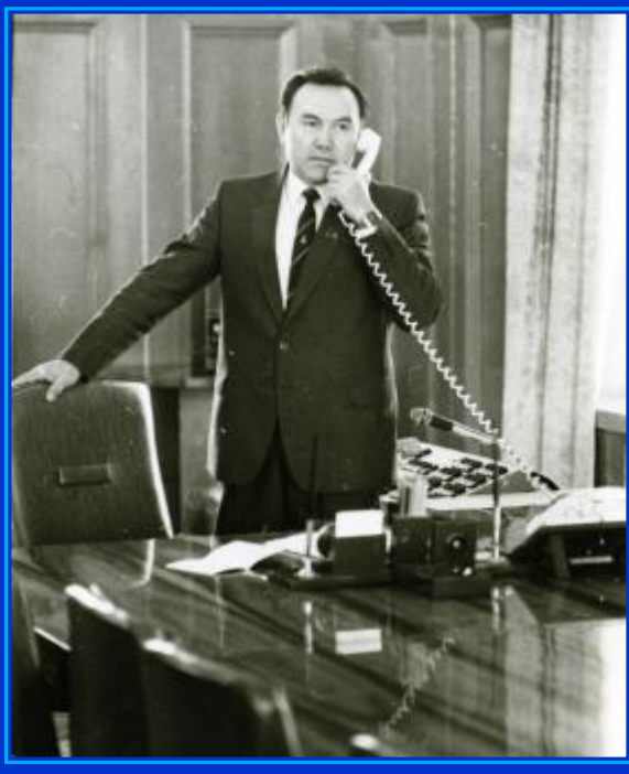
Председатель Совета Министров

Начиналась новая эпоха независимого Казахстана.