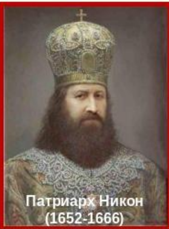
Патриарх Никон (1652-1666)

1652 г. – избрание Никона новым патрирхом России