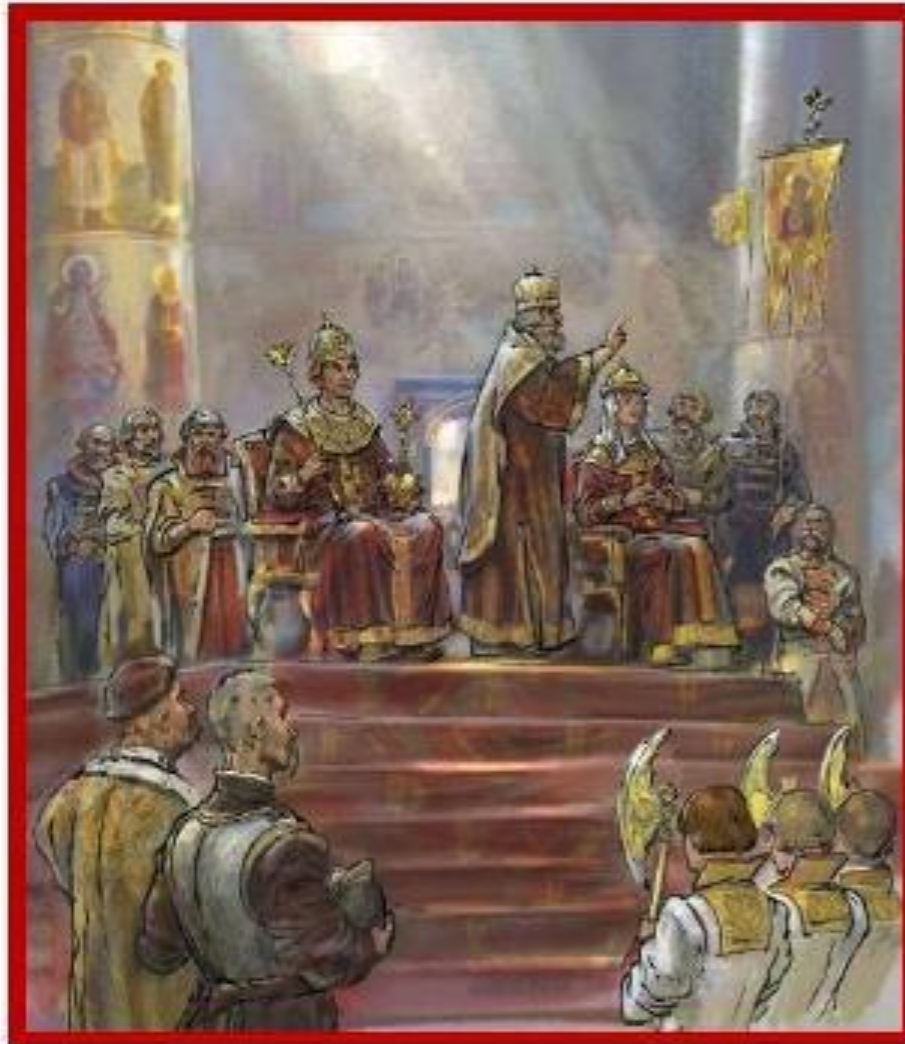
Венчание на царство Марины Мнишек