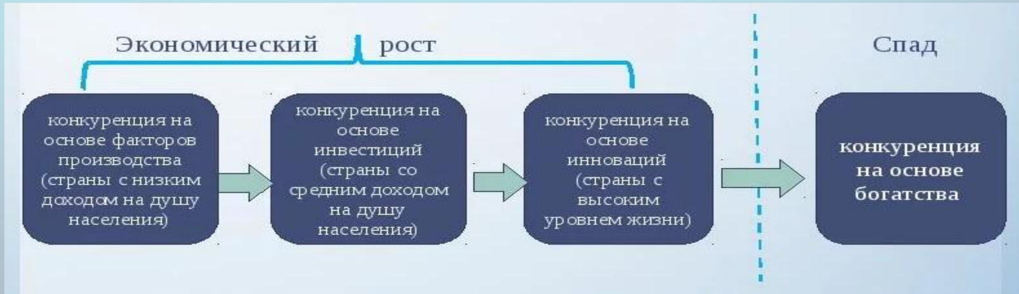
Рис. 1. Стадии конкурентоспособности национальной экономики

Портер выделяет четыре особые стадии конкурентоспособности национальной экономики, соответствующим четырём основным движущим силам, или стимулам, определяющим её развитие в отдельные периоды времени, – это факторы производства, инвестиции, нововведения и богатство (рис. 1).