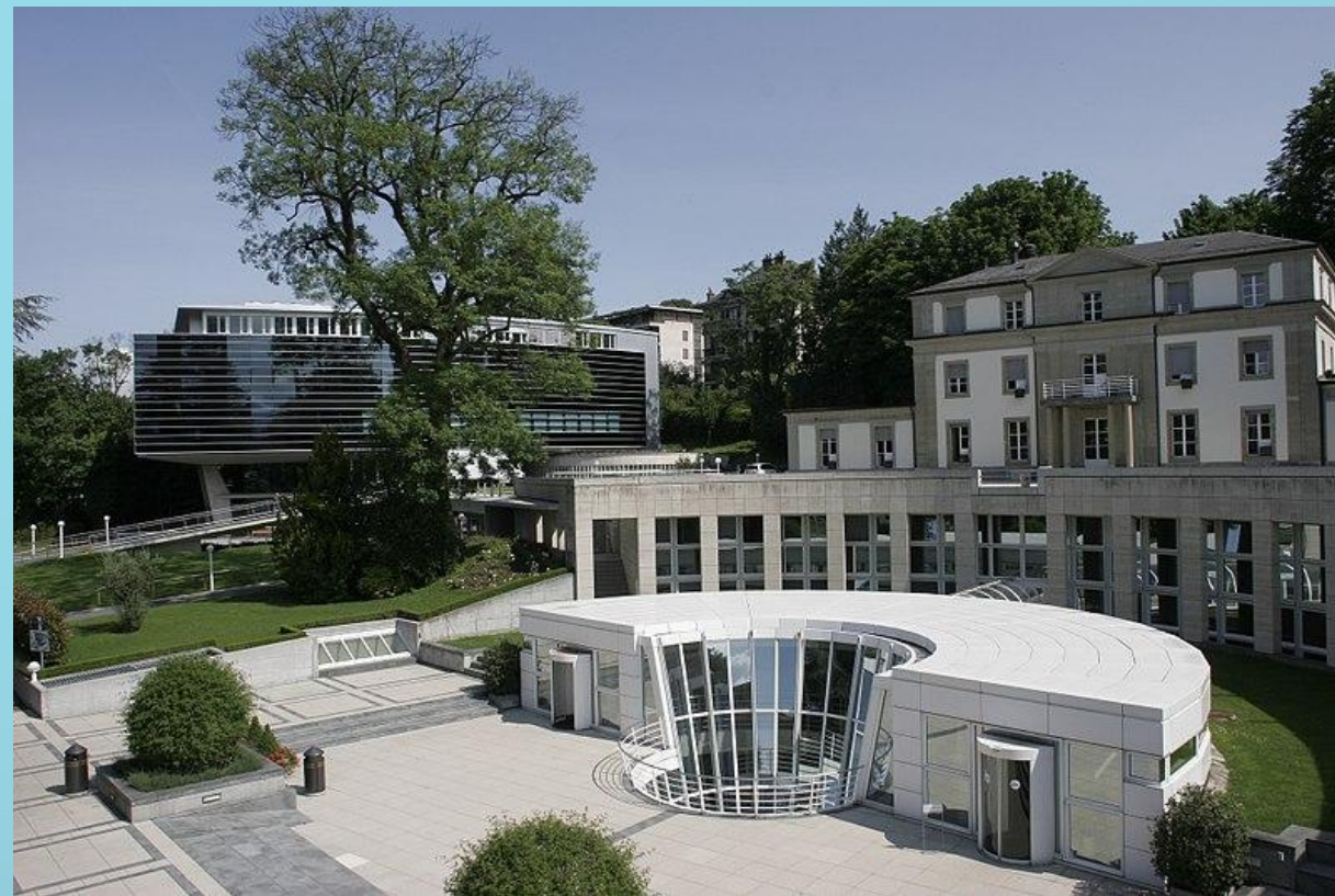
Кампус IMD. Швейцария, Лозанна

Подробный рапорт с рейтингом публикуется ежегодно с 1980 г., а содержащиеся в нем данные часто являются предпосылкой для принятия инвестиционных решений.