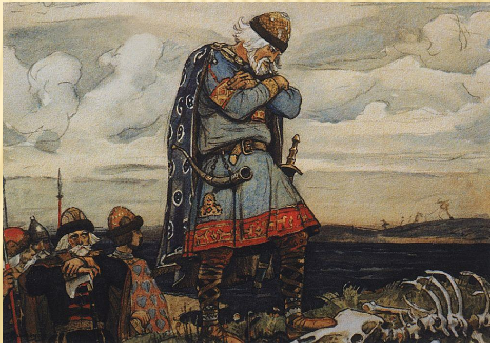
В. М. Васнецов «Князь Олег у костей»