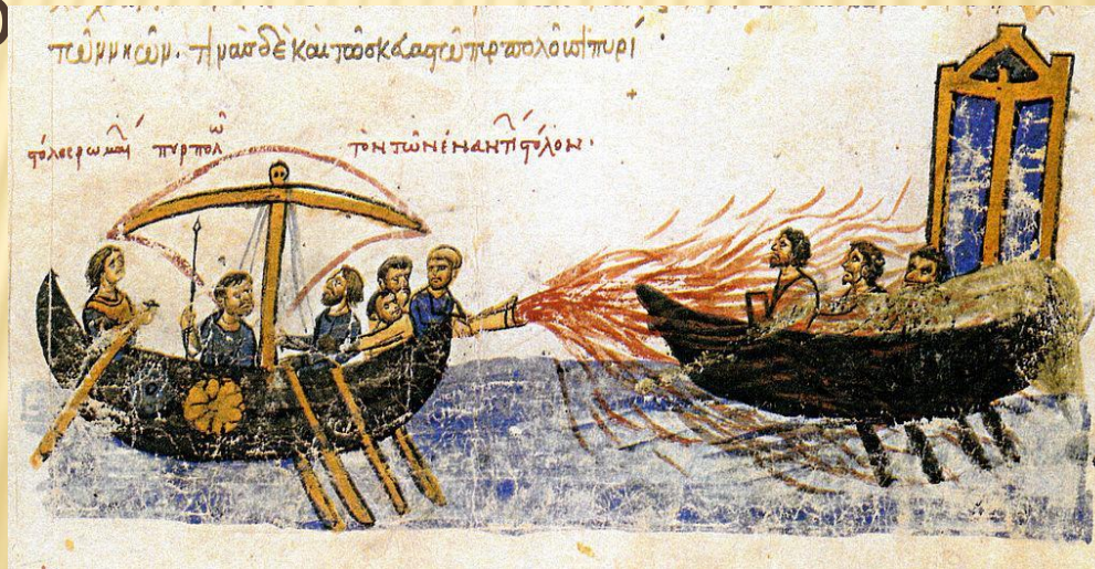
Применение греческого (морского) огня из византийской хроники