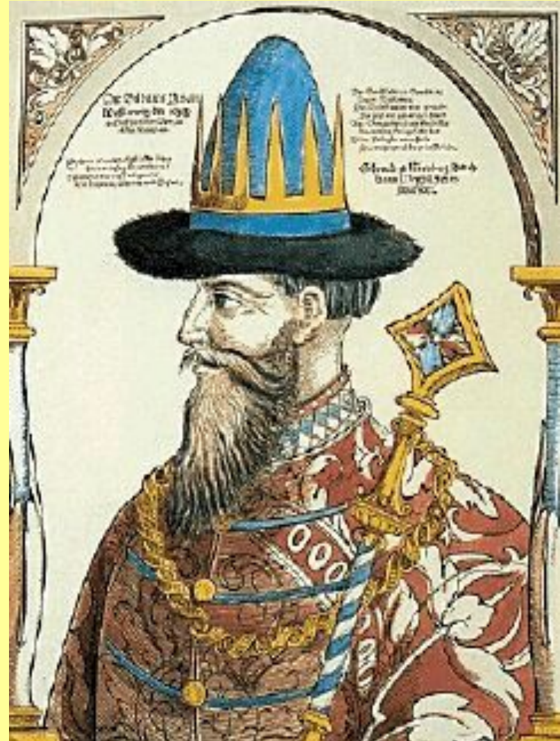
Иван IV. Старинная немецкая гравюра