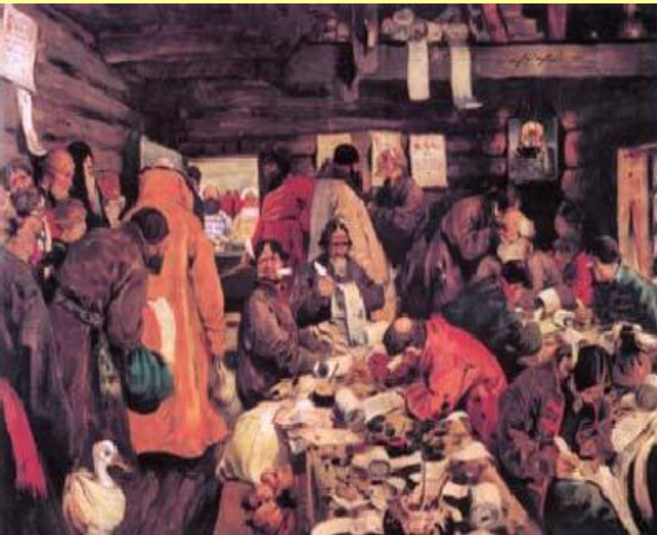
В приказе московских времен. Худ. В. Иванов.

Приказные люди жили не столько за счет жалования, сколько за счет «посулов»