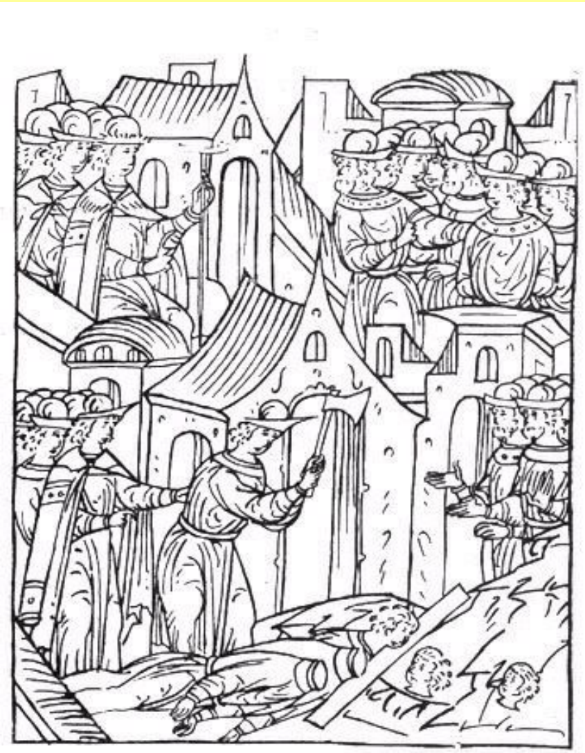
Казни бояр в 1546 г.

Первый приказ о казни отдал в 13 лет – велел псарям убить князя Андрея Шуйского