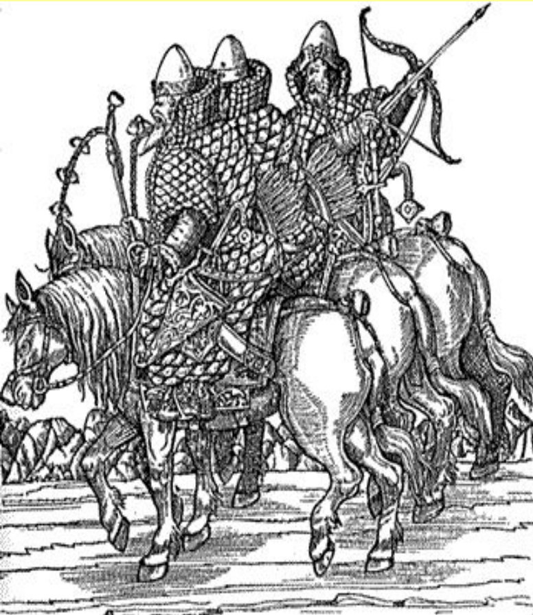
Русские всадники. Из «Записок» С. Герберштейна. 1566 г.

С каждых 100 четвертей земли – 1 вооруженный человек на коне