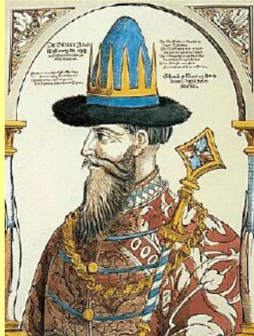
Иван IV. Старинная немецкая гравюра