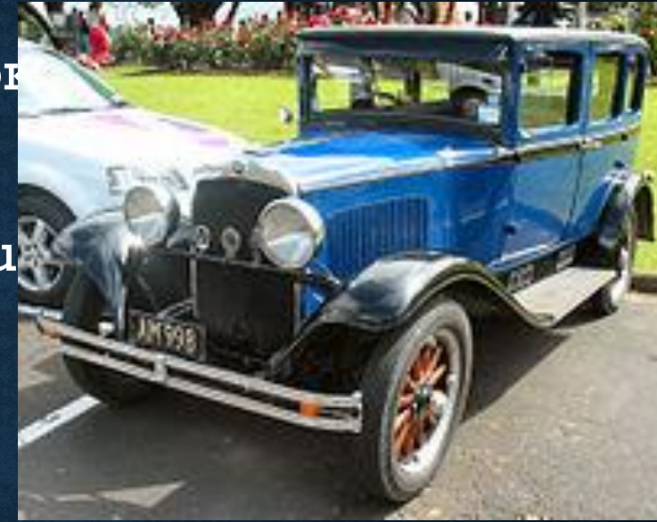
Plymouth, 1928 г.