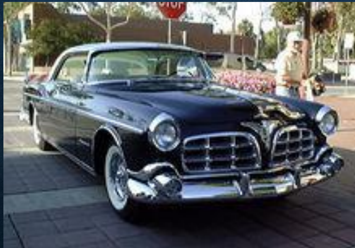
DeSoto, 1929 г.