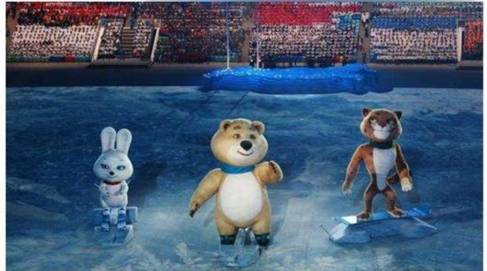
Церемония открытия XXII Зимних Олимпийских игр