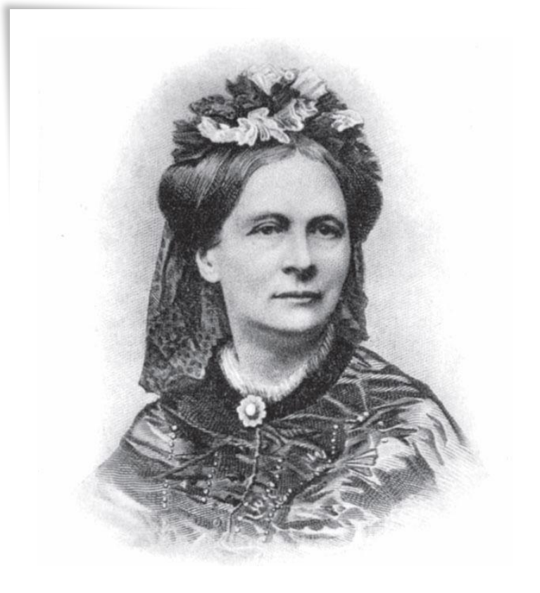
Княгиня Елена Павловна