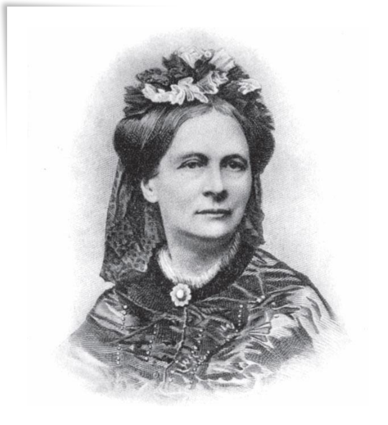
Княгиня Елена Павловна