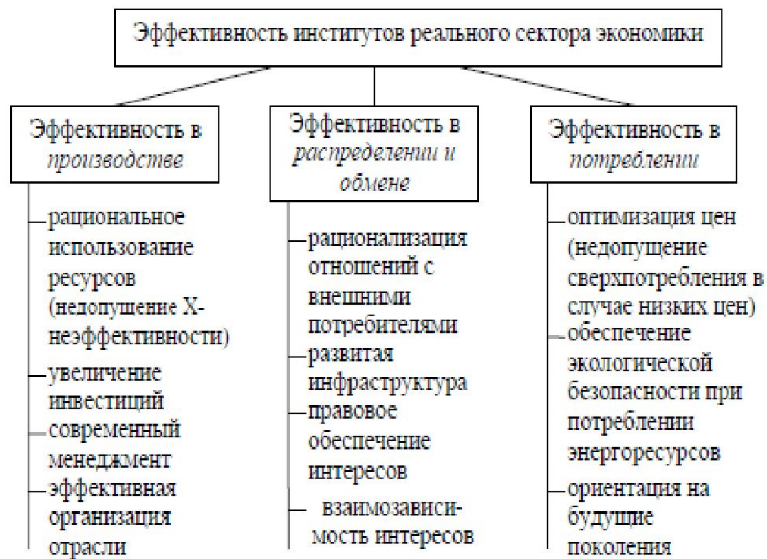
Рис. 5.2. Эффективность институтов реального сектора экономики