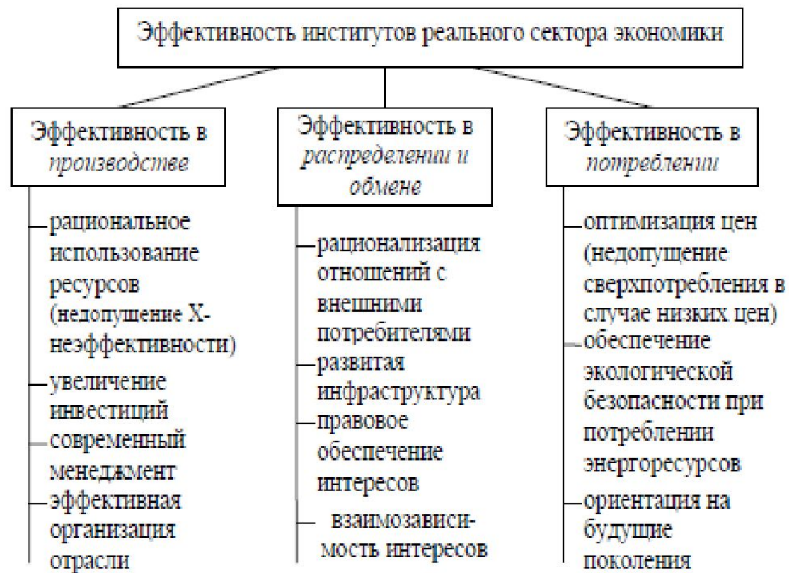
Рис. 5.2. Эффективность институтов реального сектора экономики