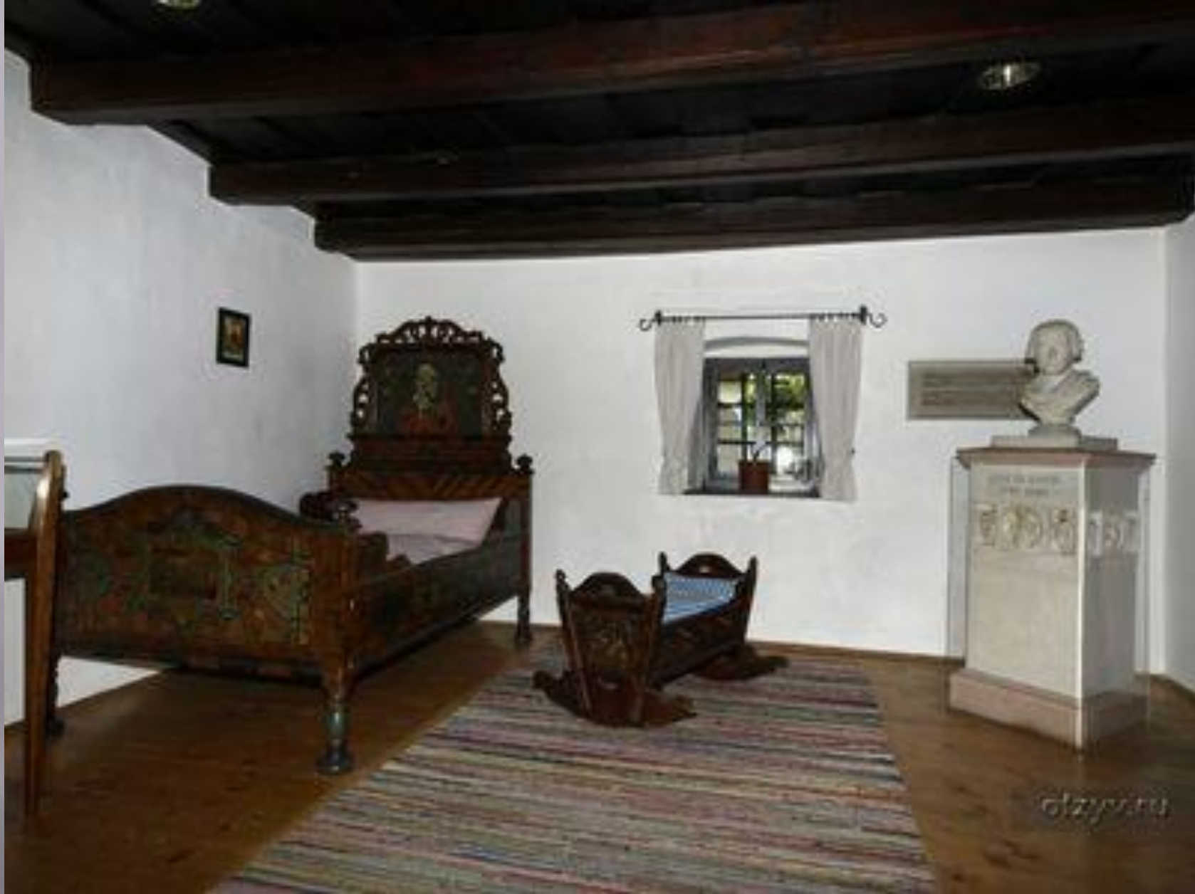
Дом-музей в Рорау