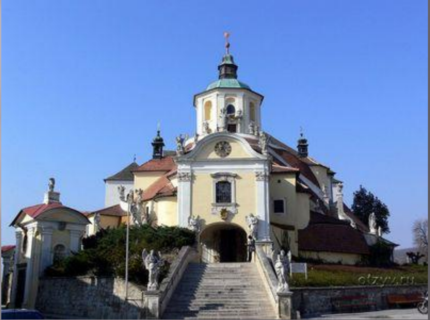
Церковь в Айзенштадте, где захоронен Й.Гайдн