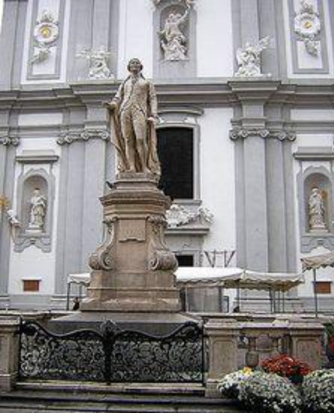
Памятник Гайдну в Вене