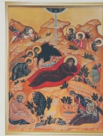
«Рождество Христово», икона Андрея Рублева, начало XV в.

По материалам документа «Арзамасские помещьские акты за 1578-1616 годы».