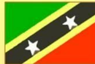
Сент-Китс и Невис