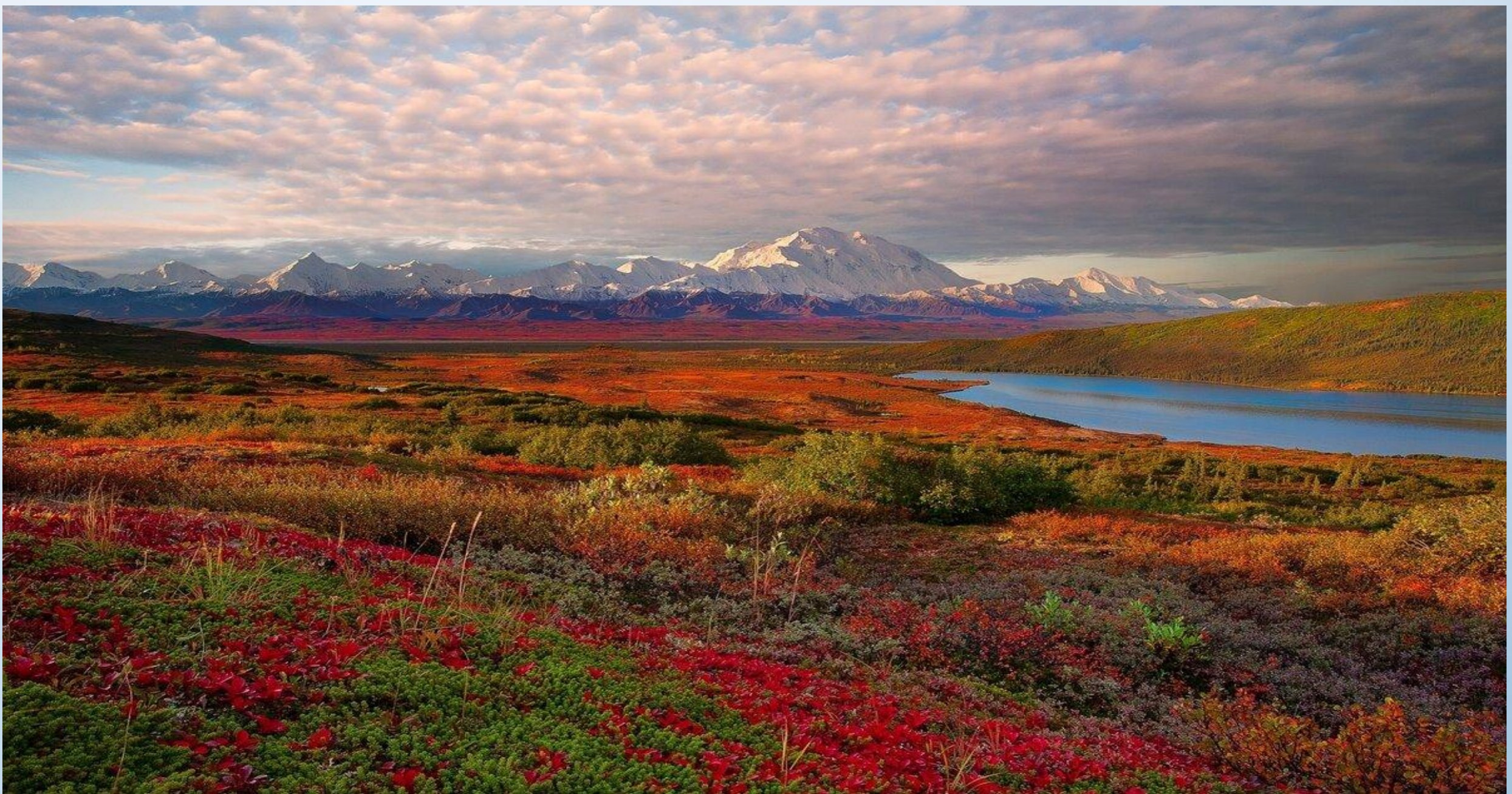
(ТУНДРА ВОСТОЧНОЙ СИБИРИ, ТАЙМЫР)