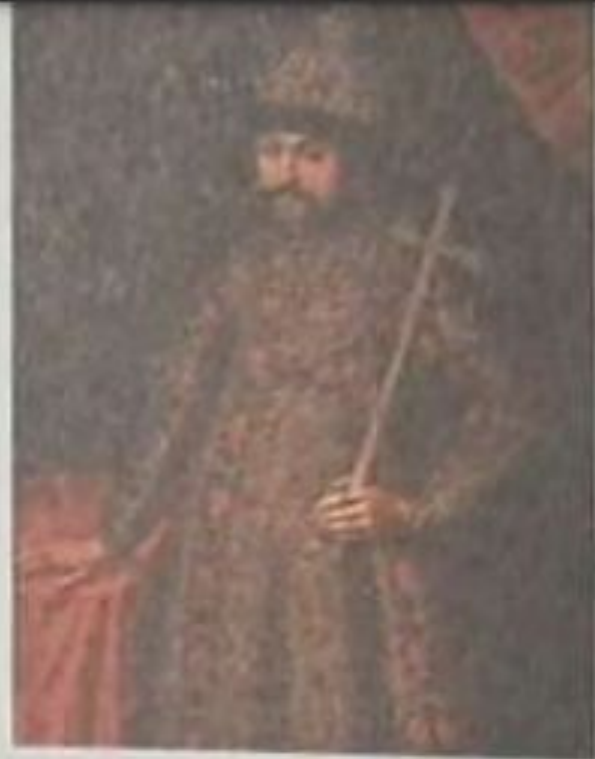
Портрет царя Михаила Фёдоровича. Худ. И. Г. Ведекинд, 1728

При правлении Лжедмитрия I их вернули в Москву, но в 1612 году мать, опасаясь за жизнь своего сына Михаила, увезла его в родовую вотчину — село Домнино. Сторонники польского короля Сигизмунда III, сын которого Владислав претен-