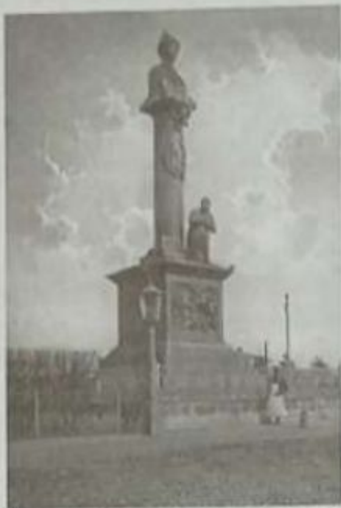
Памятник царю Михаилу Фёдоровичу и крестьянину Ивану Сусанину, г. Кострома. 1851. Скульптор В. И. Демут-Малиновский.