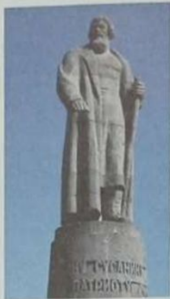
Памятник Ивану Сусанину, г. Кострома. 1967. Скульптор Н. А. Ловинский.