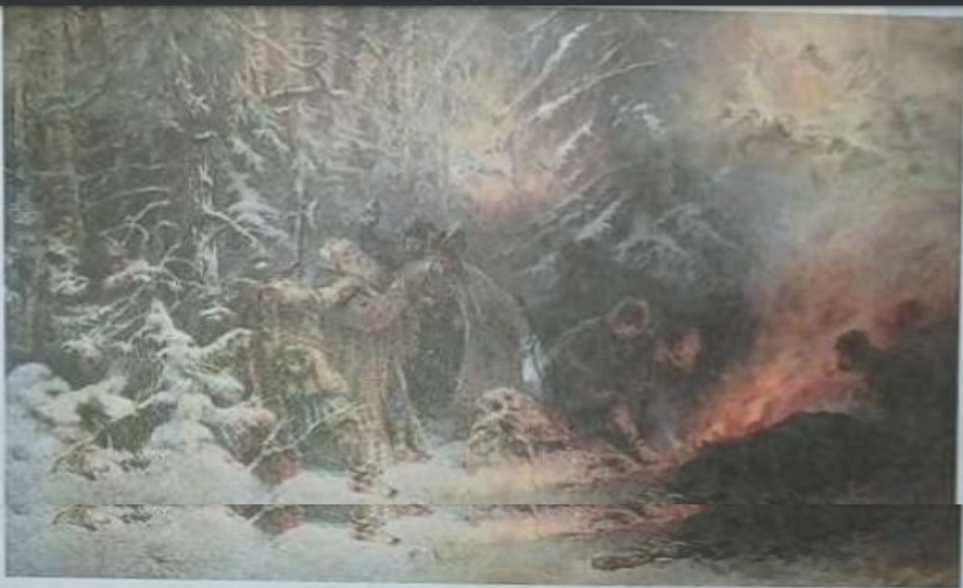
Иван Сусанин. Худ. К. Е. Маковский, 1914