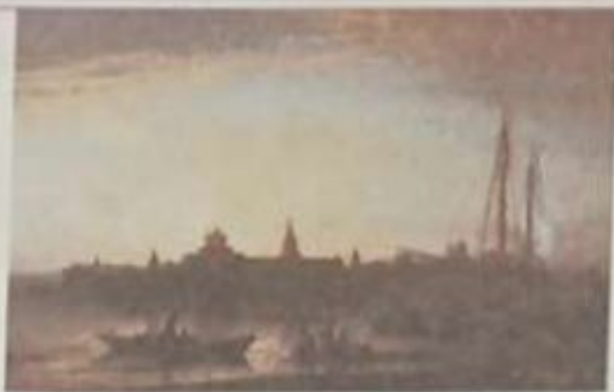
Ипатьевский монастырь близ Костромы.

► Ипатьевская обитель — Свято-Троицкий Ипатьевский мужской монастырь, основанный в XIV веке в западной части города Костромы недалеко от места впадения реки Костромы в Волгу. Монастырь сыграл особую роль в Смутное время: за его стенами укрывался будущий первый царь из династии Романовых Михаил Фёдорович. Впоследствии все русские правители из династии Романовых были покровителями монастыря и способствовали его укреплению и развитию. В архивах монастыря историк Н. М. Карамзин обнаружил одну из древнейших русских летописей — Ипатьевскую летопись, получившую своё название в честь монастыря. ◀