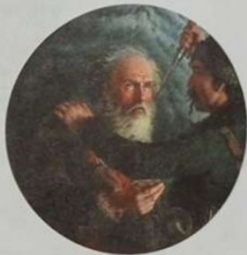
Подвиг Ивана Сусанина. Худ. М. И. Скотти, 1851

► Исторических документов, которые подтверждают подвиг Ивана Сусанина (втор. пол. XVI в. (?) — 1613), жившего в селе Домнино под Костромой, сохранилось совсем немного. Главным свидетельством считается «Жалованная грамота царя Михаила Федоровича наследникам Ивана Сусанина» от 30 ноября 1619 года, в которой содержится следующая запись: «...В те годы приходили в Костромской уезд польские и литовские люди, а... Ивана Сусанина литовские люди изымали, и его пытали великими немерными муками, а пытали у него, где в те поры мы, великий государь, царь и великий князь Михаил Фёдорович всея Руси были, и он, Иван, ведая про нас... где мы в те поры были... не сказал, и польские и литовские люди замучили