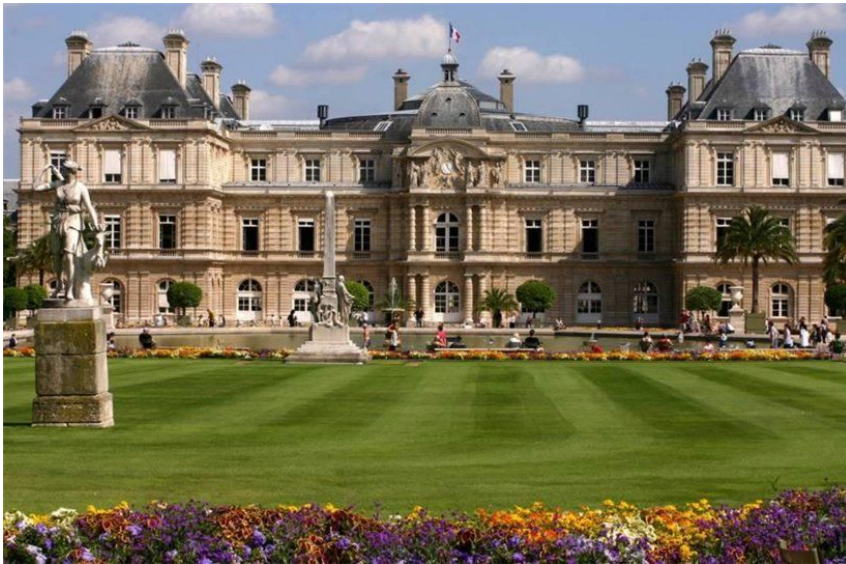
Франсуа Мансар Мезон-Лаффит (1642-1649)