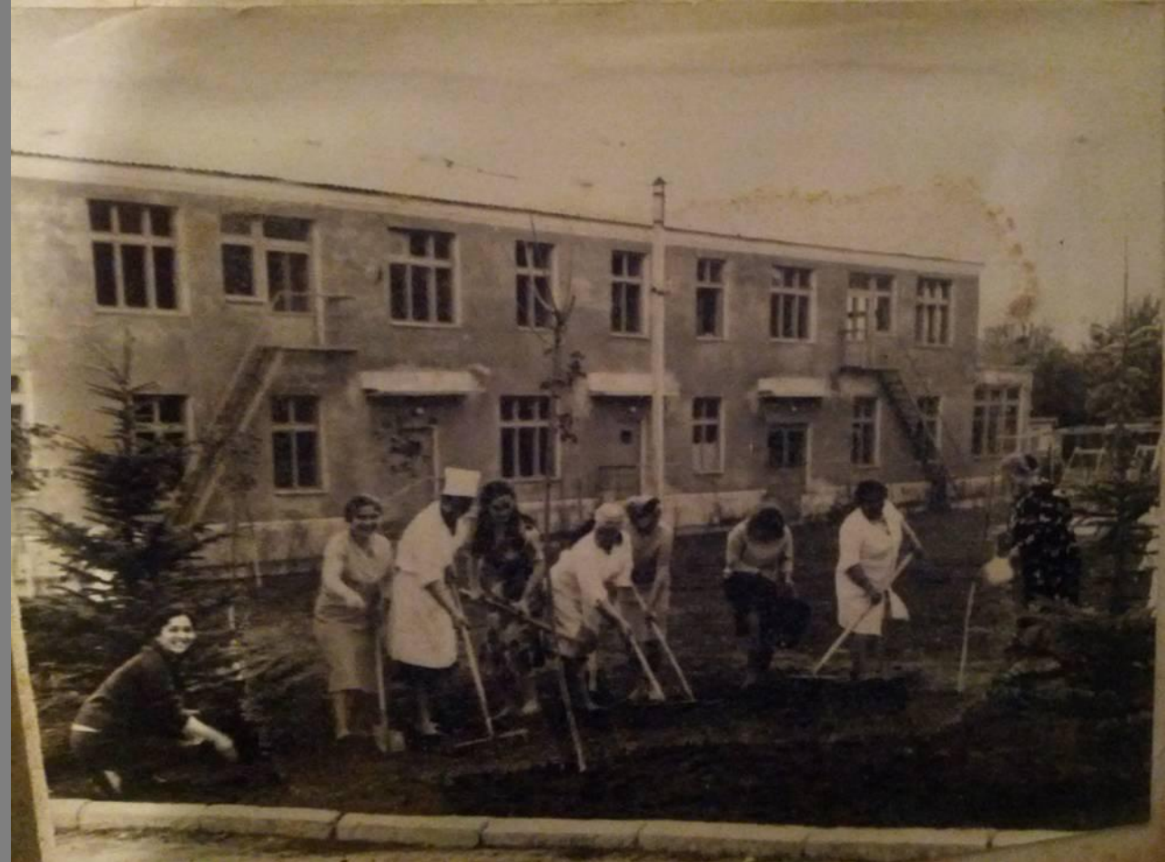
Больница и поликлиника нашего села.