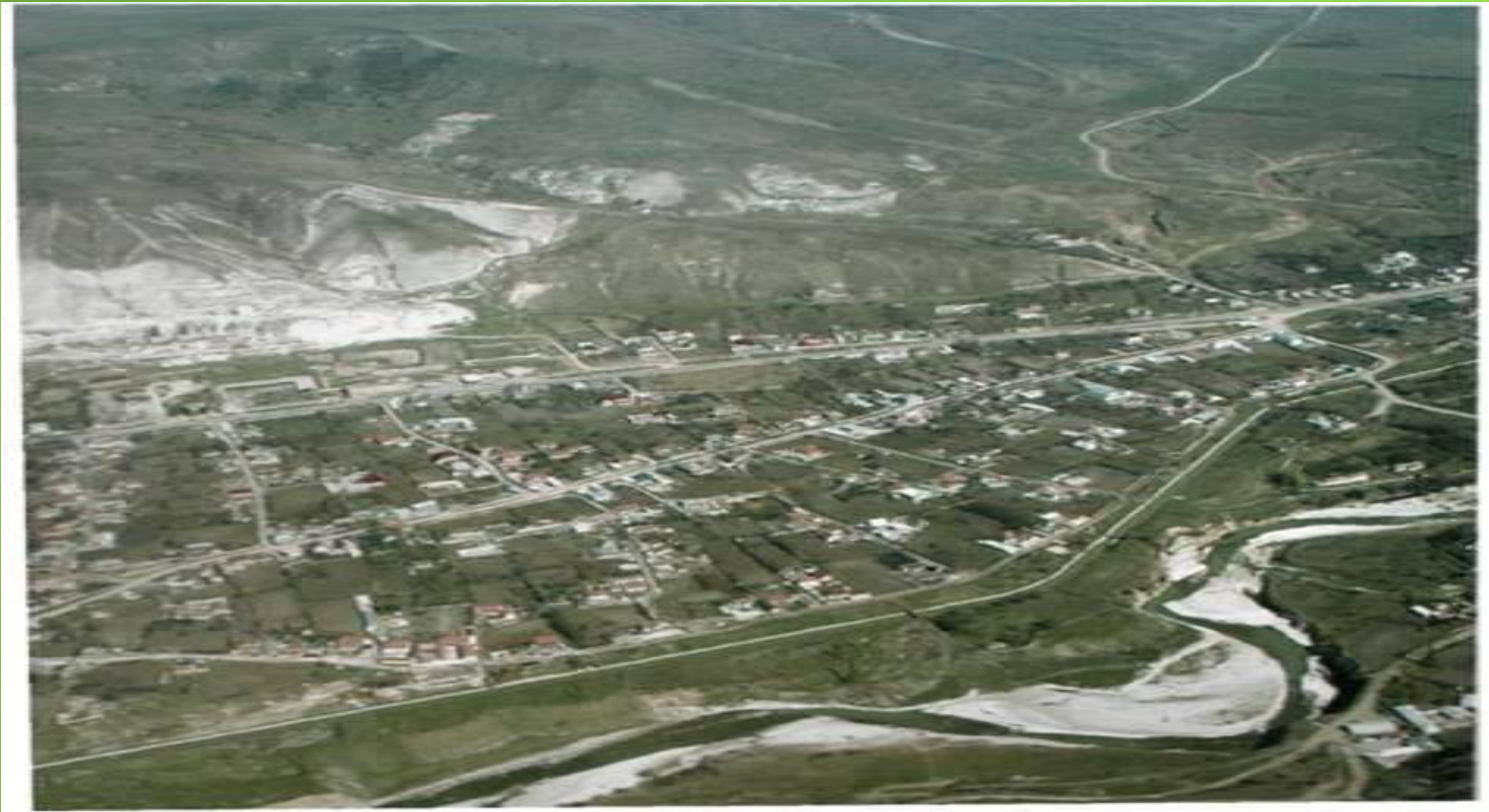
Вид Заюково с парашюта