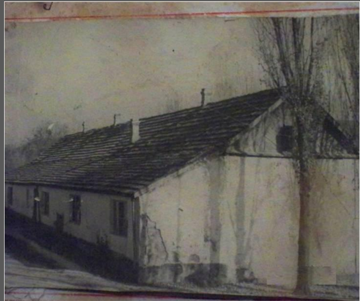
Первая школа села.