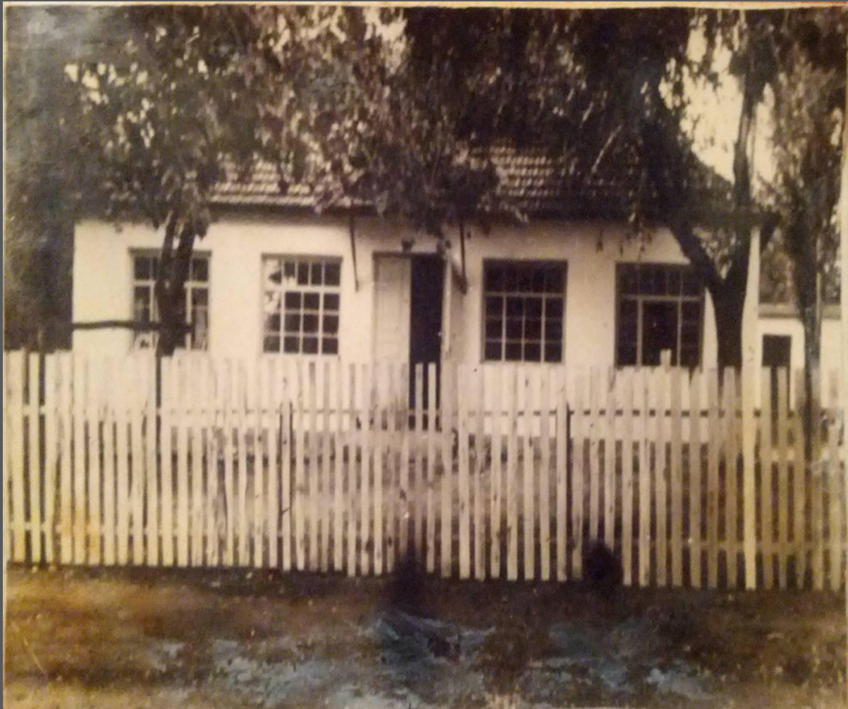
Первый детский сад села.