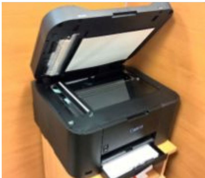
Принтер МФУ Canon MAXIFY MB2140