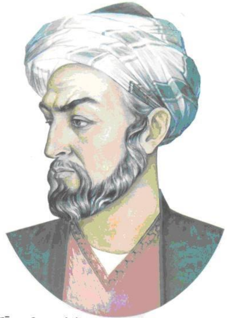
Абуали Сино - Avicenna